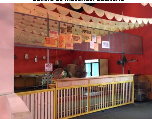
Cafetería de Macondo