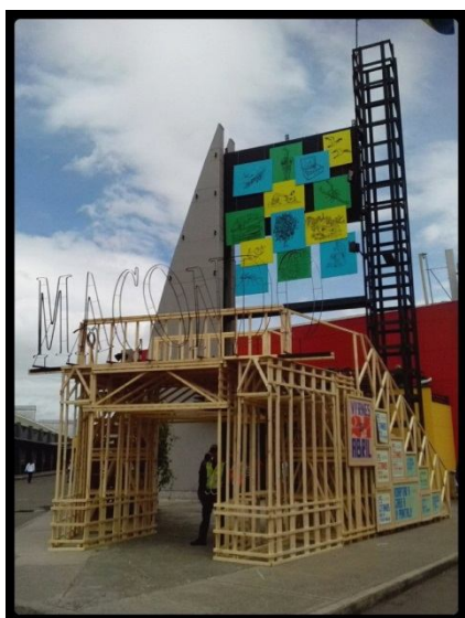
Entrada principal pabellón Macondo

Este año 2015 el invitado de honor ha sido el pueblo ficticio de la novela Cien años de soledad .