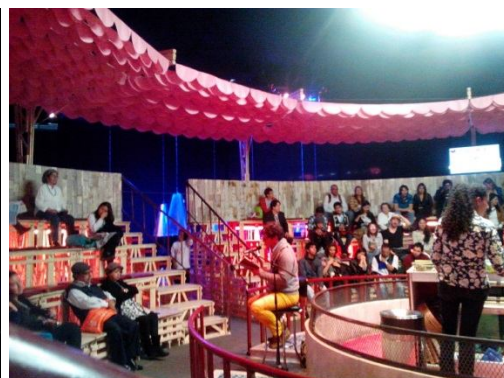
Gallera de Macondo: auditorio