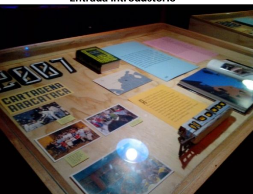
Exposición Gabriel, el viajero