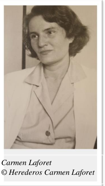
Carmen Laforet

Carmen Laforet falleció en Majadahonda (Madrid) el 29 de febrero de 2004.