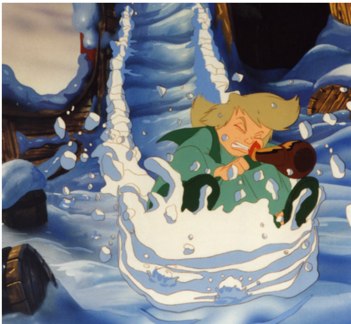
El regreso del Viento del Norte

en inglés que es la lengua común de la animación en todo el mundo; que no tengan miedo a buscar trabajo en producciones fuera de España, aprenderán mucho y serán mejor valorados cuando vuelvan; y sobre todo que asuman que, como todos los trabajos vocacionales, el cine y la animación son una carrera de fon- do. Paciencia y que no tiren la toalla cuando la meta se vea lejos. Se acaba llegando ●