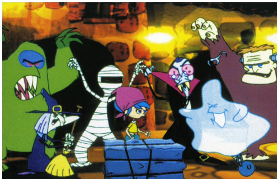
La leyenda del unicornio

nas conclusiones. Como decía antes, que un largometraje pueda llegar a producirse tiene mucho que ver con que consiga ser subvencionado por uno o varios organismos oficiales. Estos utilizan como manera de selección el sistema de comisiones de "expertos" en los que unas cuantas personas elegidas por los/as responsables de los departamentos de Cultura (en las comunidades autónomas pueden ser unas cinco) evalúan a los aspirantes y seleccionan a los que según su criterio merecen el apoyo del dinero público que van a repartir. Ahí es donde se está decidiendo el tipo de cine que se va a hacer en el país. Pese a que se intentan implementar sistemas de puntuación lo más objetivos posibles, la realidad