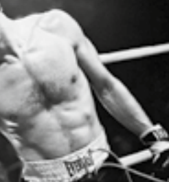
Toro salvaje (Martin Scorsese, 1980)