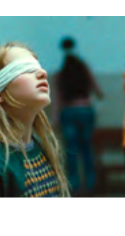
Corpo Celeste (Alice Rohrwacher, 2011)