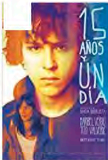
15 años y un día Writer (2013)