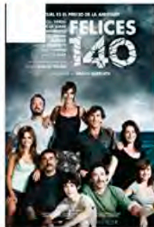
Felices 140 Writer (2015)