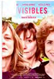
Invisibles Writer (2020)