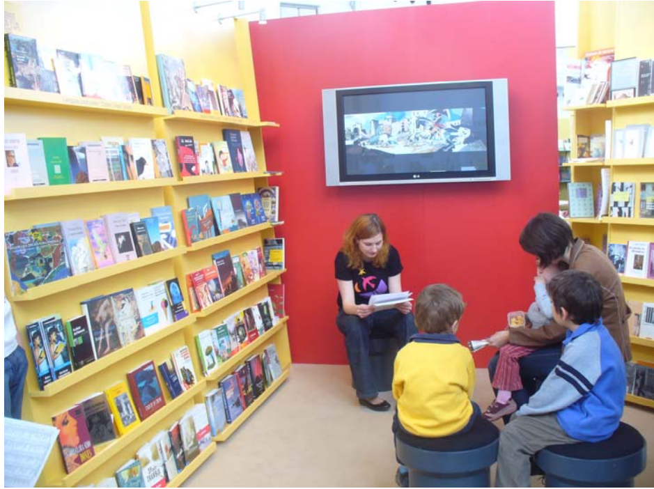
Cuentacuentos en el stand del Ministerio de Cultura