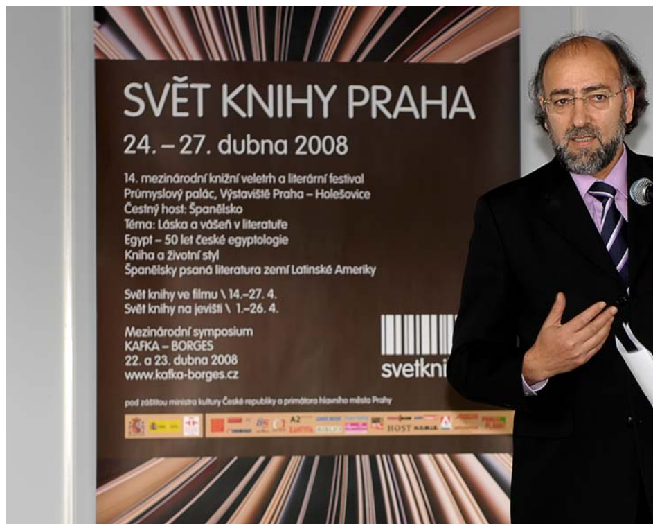
Rogelio Blanco, Director General del Libro, Archivos y Bibliotecas, en el acto inaugural de la Feria