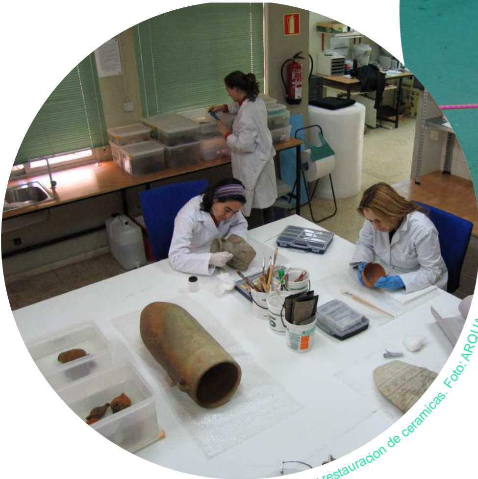
Conservación y restauración de cerámicas.

Por ello y, en base a la legislación proteccionista vigente en España, hay que establecer una serie de líneas básicas de protección, con actuaciones concretas para preservar este legado a las generaciones futuras.