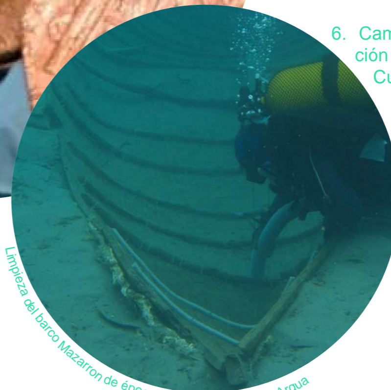
Limpeza del barco Mazarron de época fenicia