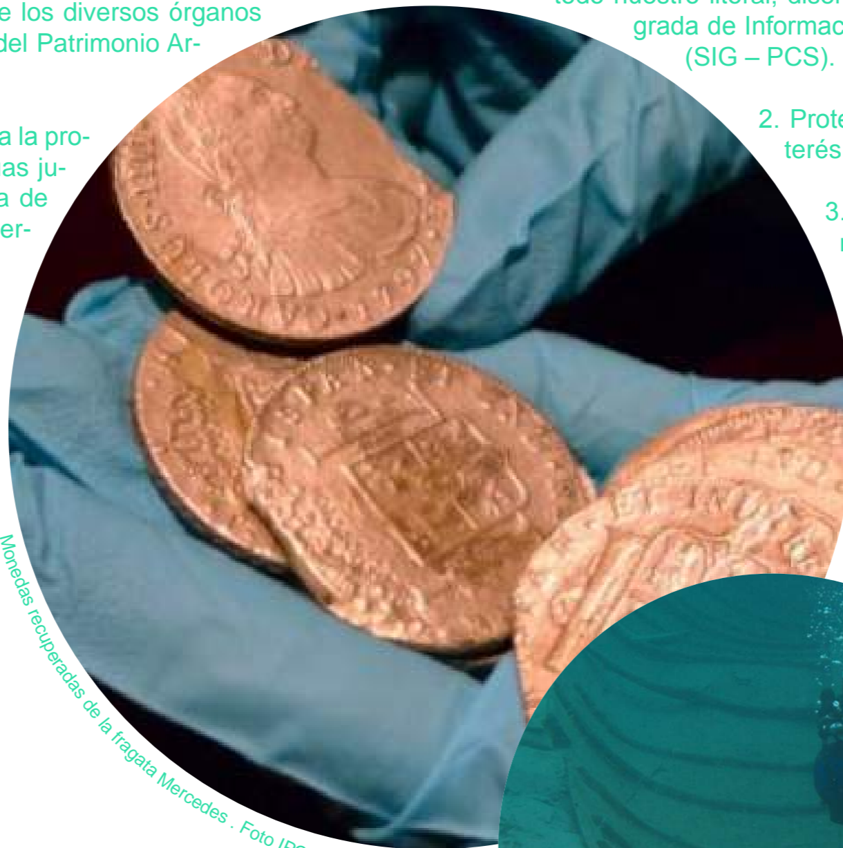
Monedas recuperadas de la fragata Mercedes .