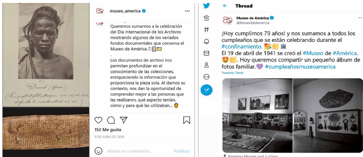
Figura 1. Publicaciones en redes sociales sobre fondos documentales del Museo de América.

Para nosotros fue importante la celebración del aniversario del Museo de América, el 19 de abril de 2020 cuando, bajo el hashtag #cumpleañasmuseoamerica , se ofreció una amplia selección de material documental y gráfico relacionado con la historia de la institución.