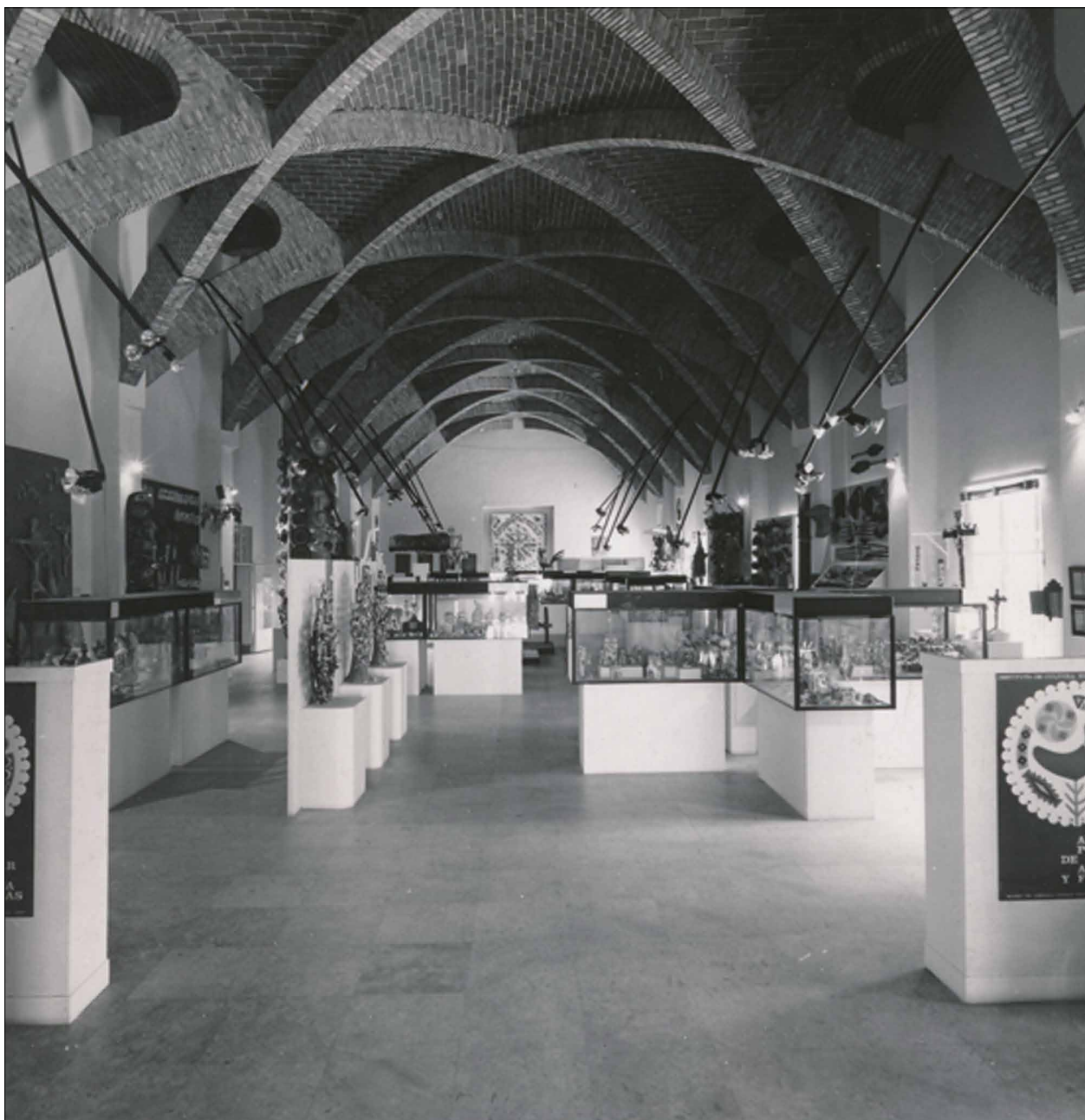
Figura 4. Ensayo de la instalación del Museo de América en Ciudad Universitaria. 1965[ca].

Merece una mención especial el trabajo de gestión, organización y conservación preventiva del Archivo de Miguel de la Quadra-Salcedo 3 , integrado por más de 10.900 fondos documentales y fotográficos: cuadernos, recortes de prensa, negativos y positivos fotográficos sobre papel y poliéster. En estos meses se han concluido las tareas de organización, clasificación y almacenamiento de este archivo, y continúan los trabajos de inventario y catalogación de sus fondos. Los documentos y fotografías participantes en la exposición temporal Miguel de la Quadra-Salcedo. Una vida de aventura (Museo de América, 28 de noviembre de 2019 a 03 de mayo de 2020 —prorrogada hasta el 1 de noviembre de 2020—) han sido digitalizados y registrados en el sistema DOMUS.