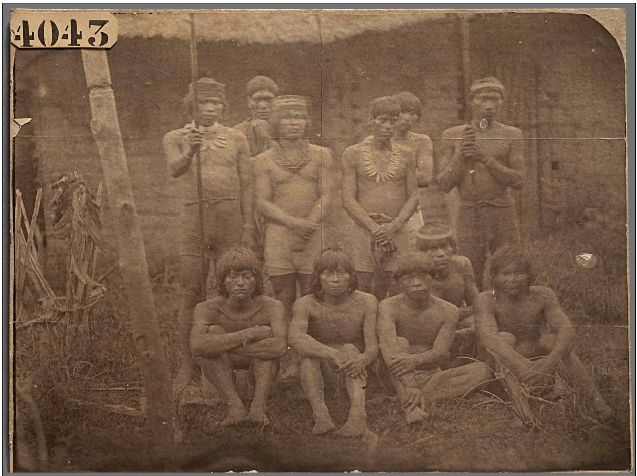
Figura 3. Indios salvajes de Guacacayo . Fotografía a la albúmina. Siglo XIX. Museo de América (FD02781).

Y qué mejor forma de celebrar el aniversario del Museo de América que redescubriendo y catalogando fondos documentales relacionados con su historia, como bocetos del arquitecto Luis Moya, felicitaciones navideñas de los años 40 o fotografías de 1965 de los ensayos de la instalación del Museo en su sede actual.