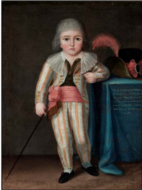
Niño Juan Crisóstomo 1800. José María Vázquez Museo Nacional del Virreinato. México

Por último, “La vida privada”, nos revela las variaciones en la representación de la familia, los hombres, las mujeres y los niños. El ideal de una familia jerarquizada, puesta bajo la protección de alguna imagen religiosa, da paso a otra regida por los afectos. No menos radicales fueron los cambios en las representaciones de hombres, mujeres y niños, y frente a los retratos dieciochescos, en los que el individuo aparece siempre inmerso en una red de relaciones sociales, surge el retrato decimonónico de la persona como ser individual.