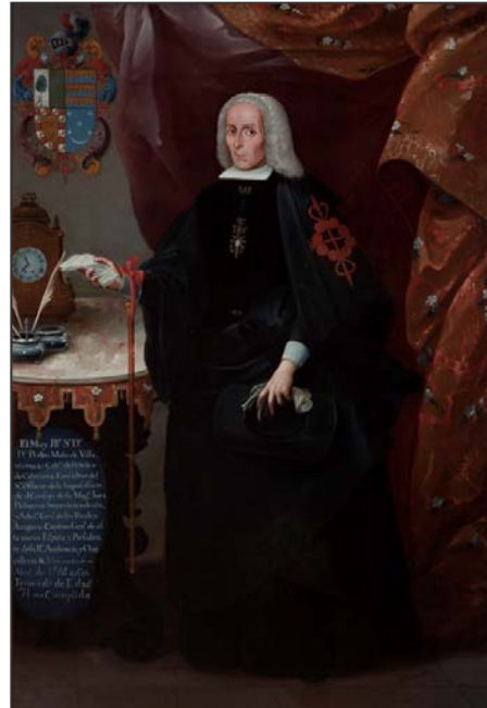
Pedro Malo de Villavicencio Siglo XVIII. José de Ibarra Museo Nacional del Virreinato. México

El retrato se convierte así en testigo y reflejo de algunas de las mutaciones más radicales y de consecuencias más duraderas en el nacimiento de la modernidad: la aparición del individuo como sujeto social y el nacimiento de la nación como forma hegemónica y excluyente de la identidad colectiva. De ahí que los objetivos que se persiguen con esta exposición sean varios, y entre los más relevantes, sus comisarios señalan el del acercamiento, coincidiendo con la celebración del bicentenario de la Independencia, a la forma cómo se construyó la nación en México.