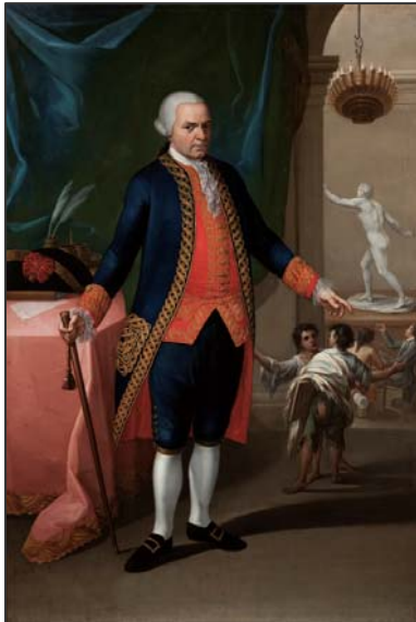
Matías de Gálvez Siglo XVIII. Anónimo Museo Nacional del Virreinato. México

· Con “ La representación del poder ”, se aprecian las variaciones en la representación de los poderosos en el tránsito de la Nueva España al México independiente. El poder político (virreyes y jefes de Estado) pero también el eclesiástico (obispos) y el de la administración civil (funcionarios).