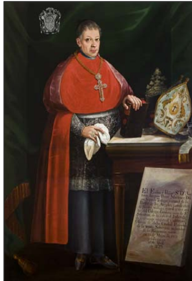
Antonio Pérez Martínez Anónimo Museo Nacional de Historia. México