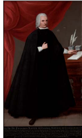
Francisco Xavier de Gamboa Siglo XVIII. Anónimo Museo Nacional del Virreinato. México

· “ Los artistas, científicos y hombres de letras ”, muestran los cambios que el nacimiento de la modernidad tuvo en la forma como los artistas, científicos e intelectuales se hicieron representar por los pintores. Unos cambios que no necesariamente están relacionados con la revolución política de la independencia, sino que tienen más que ver con el desarrollo de las ideas ilustradas y, en el caso de los artistas, con la fundación de la Academia de Bellas Artes de San Carlos de México.