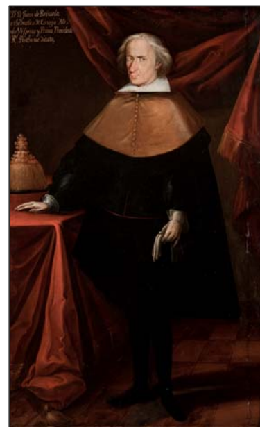
Juan de Brisuela Siglo VIII. Anónimo Museo Nacional del Virreinato. México

· “ Los artistas, científicos y hombres de letras ”, muestran los cambios que el nacimiento de la modernidad tuvo en la forma como los artistas, científicos e intelectuales se hicieron representar por los pintores. Unos cambios que no necesariamente están relacionados con la revolución política de la independencia, sino que tienen más que ver con el desarrollo de las ideas ilustradas y, en el caso de los artistas, con la fundación de la Academia de Bellas Artes de San Carlos de México.