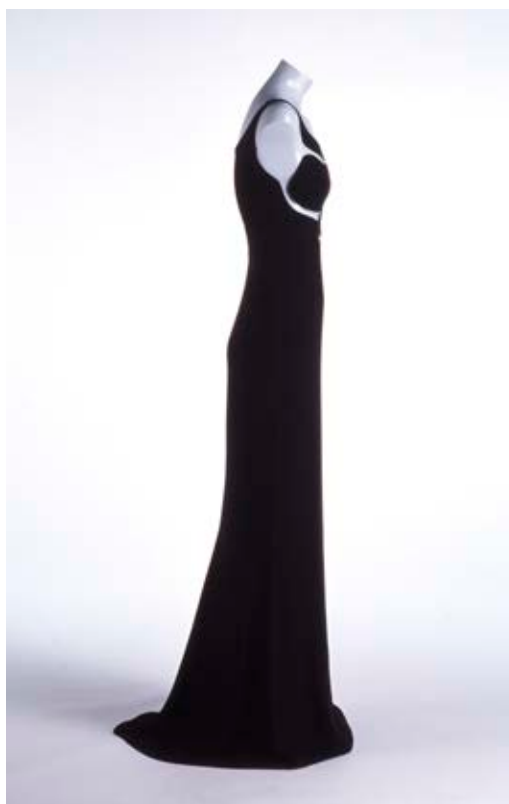
Fig. 8. Alzado y perfil del vestido España , 1996, de Sybilla. Colección Museo del Traje, Madrid