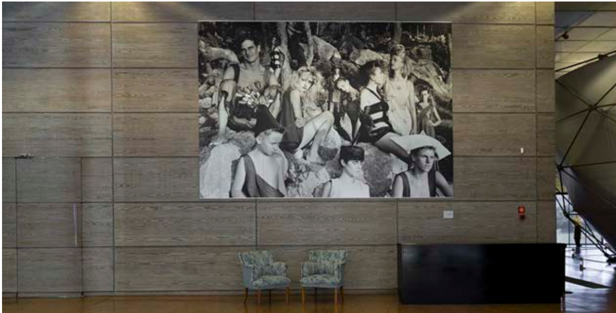
Fig. 1. Área de acogida del Museo del Traje, primera planta. Fotografía Personajes del bosque , 1985, Ouka Leele. Museo del Traje, Madrid (MT101183)