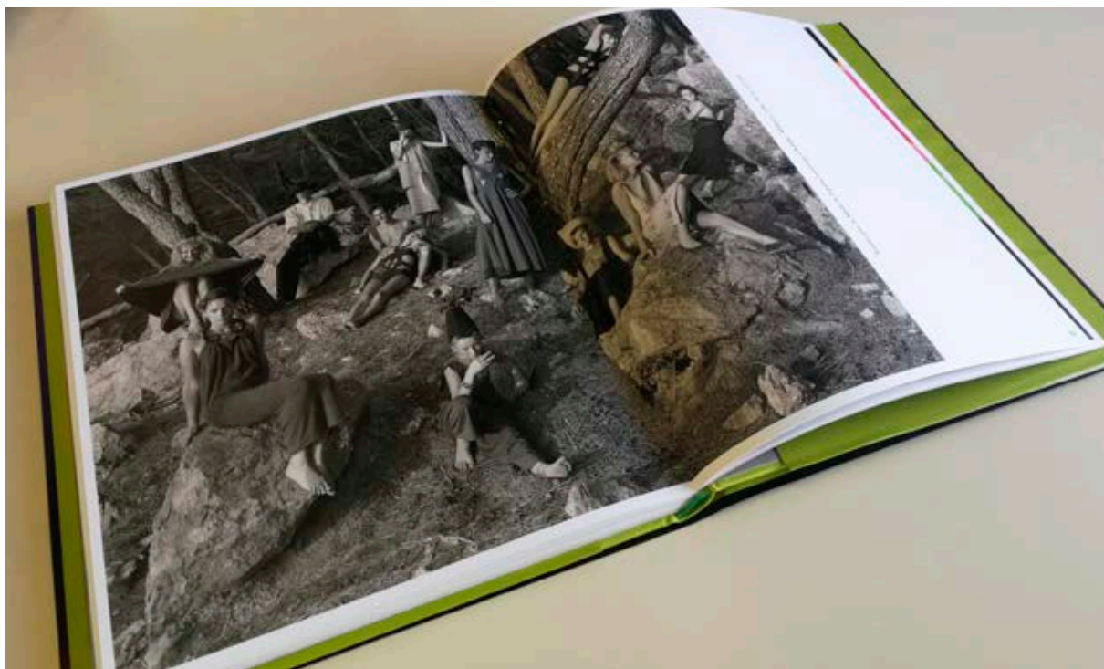
Fig. 4. Catálogo de la exposición temporal “Ouka Leele inédita”, TF, 2008. Fotografía Ensayo para la Moda España, homenaje a Sybilla , 1985, Ouka Leele.

cultural mediante su pertenencia a la “Movida madrileña” –con diferentes opiniones sobre su grado de aportación e influencia 10 –. E, inclusive, su interconexión generacional: apenas seis años de distancia entre la fotógrafa madrileña, nacida en 1957, y la modista neoyorkina, nacida en 1963.