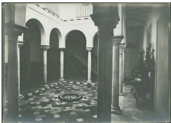
Patio de una de las Hospederías del Barrio de Santa Cruz. C/ Pimienta, 9.

Así, será célebre su proyecto de las Hospederías del Barrio de Santa Cruz, que dio comienzo en 1920 a partir de unas casas que había adquirido allí años atrás. Con él se pretendía no sólo crear en Sevilla los primeros “alojamientos regionales”, sino regenerar y sanear esta zona de la ciudad sin perder su carácter original. Estas casas serán alquiladas a particulares en un principio. En ocasiones alojaron a visitantes ilustres; sin embargo, no tendrán éxito finalmente los planes que el Marqués tenía para ellas.