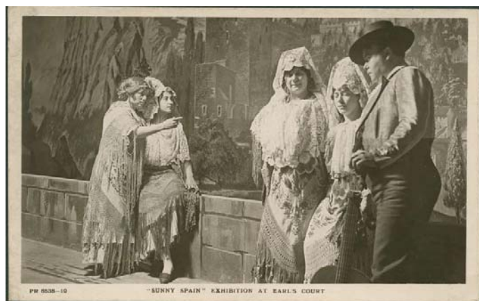
Postal de la Exposición de Turismo de Londres, 1914. Archivo Vega-Inclán. Museo del Romanticismo

Poco después, la Comisaría emprendió la tarea de preparar la participación en la próxima Exposición Internacional de Turismo de Londres, en 1914. Ante la falta de apoyo del gobierno inglés, esta exposición pasó de tener carácter internacional a meramente hispano-inglesa, celebrándose en la Sala de la Emperatriz de Earl's Court de Londres. España hará un gran esfuerzo económico destinado al diseño y construcción del pabellón, así como a la propaganda y a las diferentes actividades que tendrían lugar. Se pretendía atraer a los visitantes no sólo mostrándoles los principales destinos turísticos de interés, sino también dando a conocer la artesanía, costumbres y trajes populares de las distintas regiones de nuestro territorio. Desgraciadamente, el estallido de la Primera Guerra Mundial truncó la trayectoria de esta Exposición a la que tanto trabajo había dedicado la Comisaría.