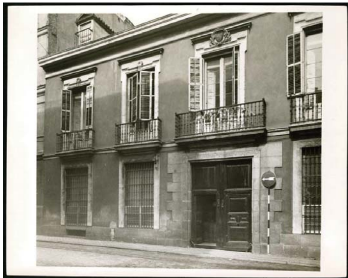
Sede de la Comisaría Regia de Turismo desde 1921 en calle San Mateo, 13. Archivo Vega-Inclán. Museo del Romanticismo

se encontraban las dependencias de la Presidencia del Consejo de Ministros pero, tras el incendio de este inmueble, pasó al domicilio particular del Marqués de la Vega-Inclán, en la plaza de los Afligidos. Posteriormente se trasladó a calle Sacramento 5 y, finalmente, en 1921, a calle San Mateo 13, donde poco después se instalaría el Museo