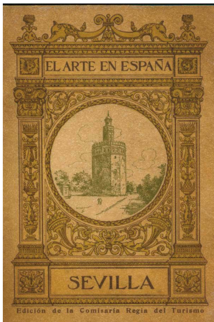
Portada del tomo dedicado a Sevilla de la colección "El Arte en España", publicada por la Comisaría Regia de Turismo. Museo del Romanticismo

La temática de la mayor parte de las mismas será el arte. Un gran ejemplo lo tenemos en la colección El arte en España , ambicioso proyecto que recogía en más de veinte tomos monográficos diferentes aspectos del patrimonio español, centrándose en una ciudad o en un monumento o artista en concreto. Cada volumen incluía un total de cuarenta y ocho imágenes de gran calidad.