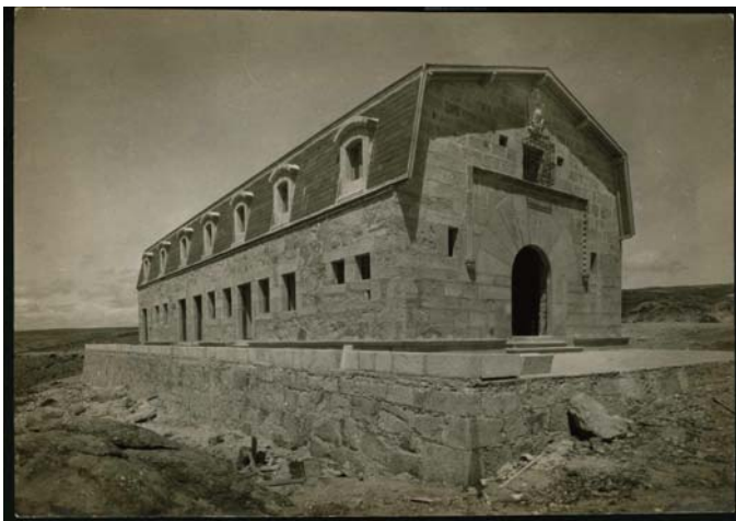
Parador de Gredos. Archivo Vega-Inclán. Museo del Romanticismo

establecimiento será solventar la carencia de refugios de montaña, mejorar su accesibilidad para los excursionistas y poner en valor la zona. Este primer parador será concluido e inaugurado por el rey en 1928.