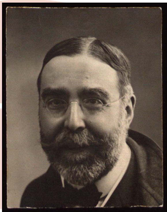
El Marqués de la Vega-Inclán.

El primer centenario del nacimiento de la Comisaría Regia del Turismo y de la Cultura Artística y Popular es un buen momento para poner en valor la importancia de esta institución pionera en España. El Marqués de la Vega-Inclán, como primer comisario regio, tomará las riendas de la gestión del turismo en España en sus estados iniciales, siendo sus planteamientos totalmente innovadores y determinantes de una serie de pautas que llegan a nuestros días. Priorizar la mejora de las infraestructuras y comunicaciones, crear una red de alojamientos rurales y urbanos asequibles, promocionar el rico patrimonio cultural español y ofrecer información y asesoramiento que hoy denominaríamos “turístico” de manera conjunta a los visitantes que se interesaran por nuestro país serán los principales objetivos del Marqués a la cabeza de la Comisaría.