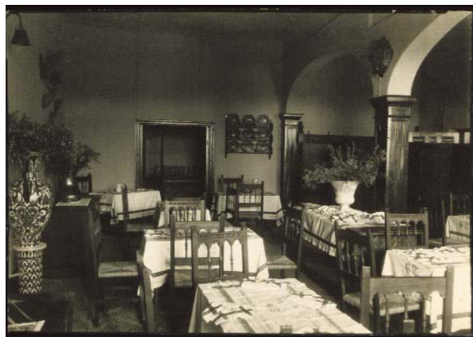
Comedor de la Hospedería toledana.

En Toledo, la Comisaría financiará la creación de una residencia de artistas, la llamada “Hospedería toledana” o “Casa del Maestro”, a la que dotará de una biblioteca. Se pretendía que sirviera para el fomento del turismo en la zona entre estudiantes y artistas.