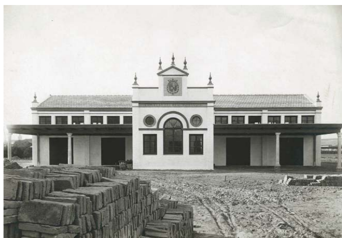
Escuela del Real Patronato de Casas Baratas. Archivo Vega-Inclán. Museo del Romanticismo

Con la construcción de viviendas asequibles para la clase obrera se pretende solucionar un problema endémico de las ciudades españolas de principios de siglo en general, y de Sevilla, en particular: la creciente mendicidad. A esto se une la necesidad de una reforma urbana de gran magnitud en previsión de la celebración de la Exposición Iberoamericana que estaba proyectada en la capital andaluza para 1914, aunque finalmente tuviese lugar varios años después, en 1929, debido a la guerra. Obedecerá asimismo a la aplicación de la Ley de Casas Baratas, promulgada en 1911. El Marqués será uno de los principales promotores del proyecto y el responsable de convencer personalmente al rey para llevarlo a cabo. Incluirá también la construcción de una escuela de párvulos en el complejo. El arquitecto de la Comisaría, el ya citado Vicente Traver, será el encargado del diseño.