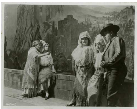
ALFIERI, Exposición "Sunny Spain" de Londres , 1914.

Las exposiciones y congresos fueron un medio excelente para dar a conocer nuestro país. Además de los actos celebrados en España, la Comisaría hizo un gran esfuerzo por divulgar nuestras excelencias en el extranjero, destacando la organización de una exposición en Londres en 1914 llamada "Sunny Spain", o diferentes incursiones en Estados Unidos.