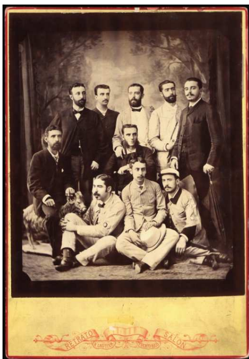
Benigno de la Vega Inclán con amigos, 1883.

La muestra da a conocer algunos de los personajes más insignes del círculo de amistades del comisario regio, entre los que se encontraban artistas de la talla de Joaquín Sorolla o Aureliano de Beruete, poetas como Antonio Fernández Grilo y personalidades de la aristocracia. También se propone un acercamiento al lado más humano del marqués de la Vega Inclán a través de divertidas instantáneas personales.