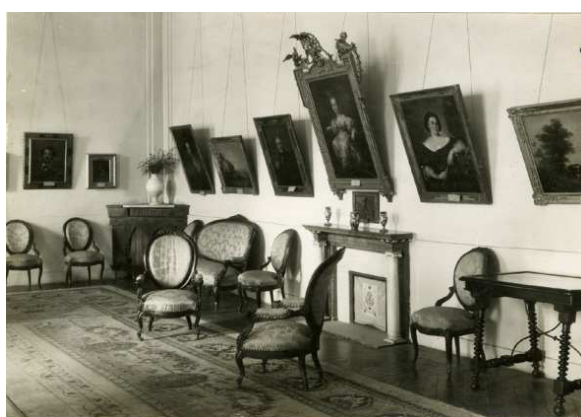
Salón de Isabel II en el Museo Romántico, 1924.

También el Museo Romántico, hoy Museo del Romanticismo y que este año cumple su 90 aniversario, fue fundado por Benigno de la Vega Inclán.