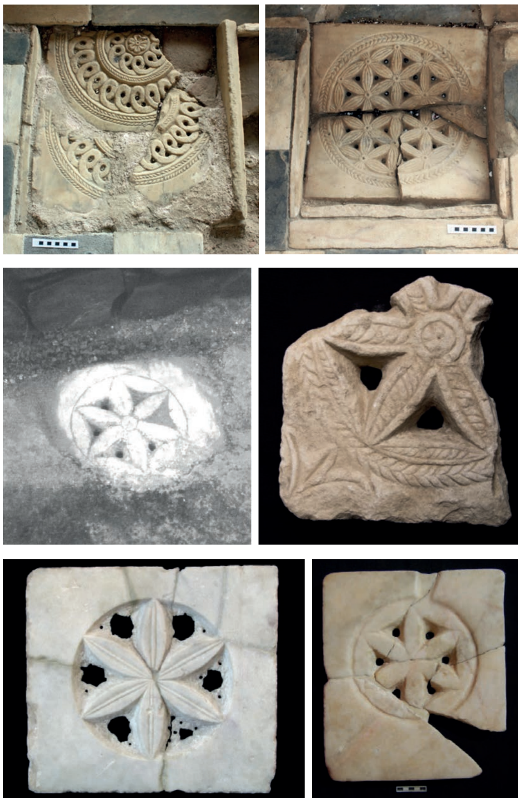
Fig. 4. De izquierda a derecha y de arriba abajo: Fig. 4a. y 4b. Sumidero norte y sur de la Casa de los Mármoles de Morerías. Fig. 4c. Sumidero de la casa nº 6 de Morerías. Fig. 4d. Placa nº inv. CE17363. Fig. 4e. Placa nº inv. CE02247. Fig. 4f. Placa nº inv. CE13896.