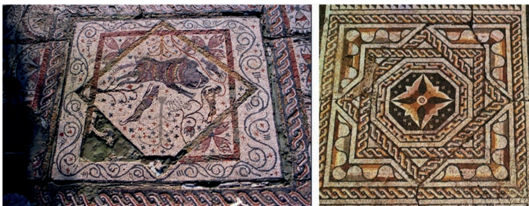
Fig. 5a. Emblema central del Mosaico del Jabalí de la calle Benito Toresano nº Inv. CE26391. Foto: Archivo MNAR. Fig. 5b. Mosaico de la villa de las Tiendas nº Inv. CE30280. Foto: Archivo MNAR. J. M. Murciano.