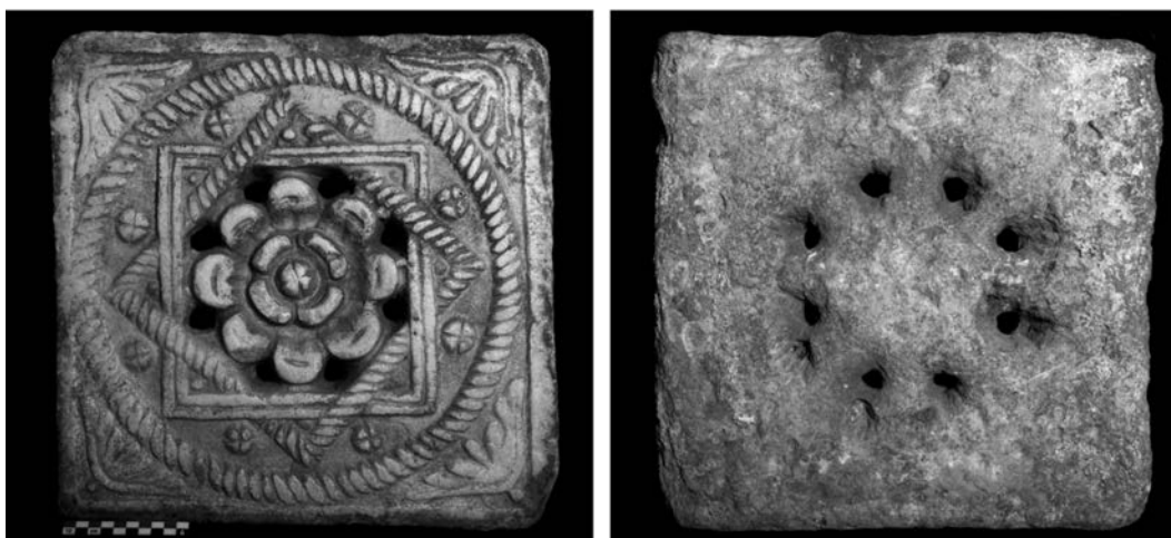
Fig. 2. Placa nº Inv. CE2020/2/1 incorporada recientemente a las colecciones del MNAR.

La placa (nº Inv. CE2020/2/1) ( Fig. 2 ) se encuentra en buen estado de conservación. Presenta formato cuadrado (40 x 40 x 4,5 cm) con roseta central, enmarcada por estrella de ocho puntas. Ésta se genera a partir de la superposición de un cuadrado de doble moldura y otro de perfil sogueado y girado 45º respecto al primero. En el centro, la roseta presenta doble corona de ocho pétalos digitalizados exteriores y otros cuatro menores con botón central. La placa está calada entre los pétalos mayores y el recuadro interior. Todo el relieve está enmarcado en un círculo sogueado inserto en un cuadrado, con palmetas en las esquinas. Ocho pequeñas flores tetrapétalas aparecen entre la estrella y el círculo sogueado exterior. El reverso es basto, con huellas del taladro y restos de mortero, que confirman su creación para ser observada únicamente desde un punto de vista frontal y embutida en una estructura arquitectónica.