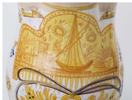
Detalle del jarro CE1/01979.

A propósito de esta serie de piezas, González Martí lanzó toda una leyenda, suponiendo que era el trabajo de un tornero, el cual había entablado relaciones amorosas con alguna de las pintoras de la fábrica en que trabajaba. Ésta había tenido la ocurrencia de decorar el plato o el jarro que después luciría en el vasar de la chimenea del futuro hogar, con una decoración ex-profeso para ella, en la que representaba todos los objetos del ajuar que estaba reuniendo. Expresaría de este modo su orgullo como novia o futura casada.