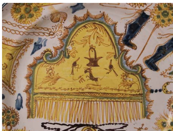
Detalle del plato CE1/03100.

La dote cobra un significado especial en el contexto de la situación social de la mujer, y del matrimonio como una de las únicas vías “decentes” por las que una mujer podía conducir su vida. El matrimonio suponía una protección legal para la mujer que pasaba de la tutela del padre a la del marido. No poseer una dote era excluirse del matrimonio que, junto con el convento, eran las únicas salidas dignas para las mujeres. Por este motivo y porque las mujeres estaban imposibilitadas para realizar trabajos cualificados, la constitución de una dote permitía