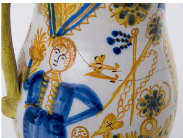
Detalle del jarro CE1/01959.

González Martí acuñó el nombre de “vajillas idílicas” a este conjunto de platos y jarros realizados en Manises que las operarias que iban a casarse pintaban para ellas con la aprobación de los propietarios de la fábrica. En ellas reflejaban los aderezos del traje valenciano de forma ingenua y minuciosa: peinetas, pendientes, rosarios, abanicos, medias, zapatos, etc., junto con otros objetos que podríamos considerar propios del ajuar de una novia. El color con el que se representan estos objetos es el amarillo, para simular el brillo del material (plata sobredorada o latón) del que estaban hechas estas joyas. En contadas piezas de esta serie aparecen además las figuras de los