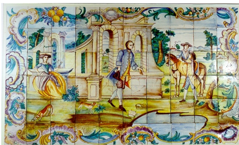
Pannello di piastrelle con scene galanti. Maiolica policroma. Valencia, XVIII secolo. CE1/00315