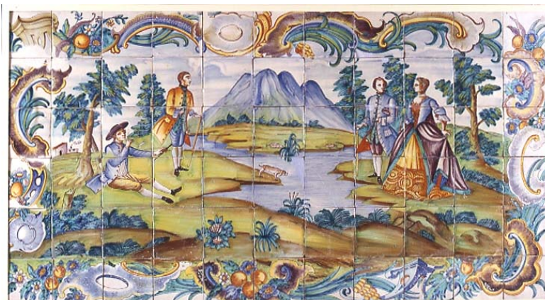
Pannello di piastrelle con scene galanti. Maiolica policroma. Valencia, XVIII secolo. CE1/00308