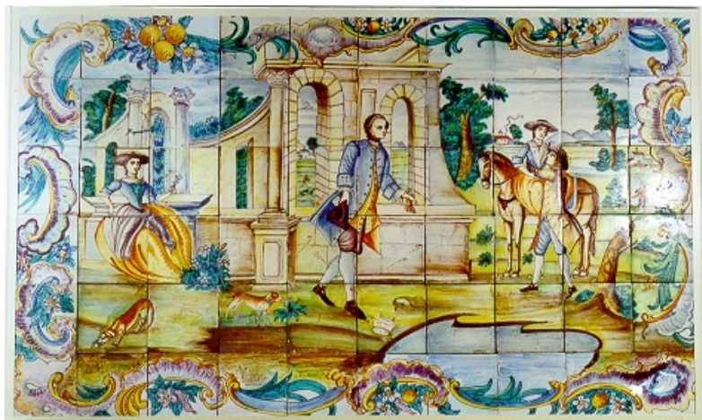
Fliesen-Paneel. Mehrfarbiges Steingut. Valencia. 18. Jahrhunderts. CE1/00315