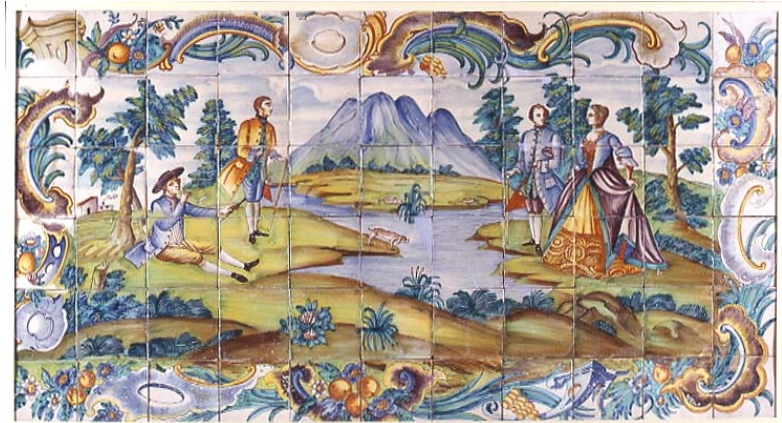
Fliesen-Paneel. Mehrfarbiges Steingut. Valencia. 18. Jahrhunderts. CE1/00308