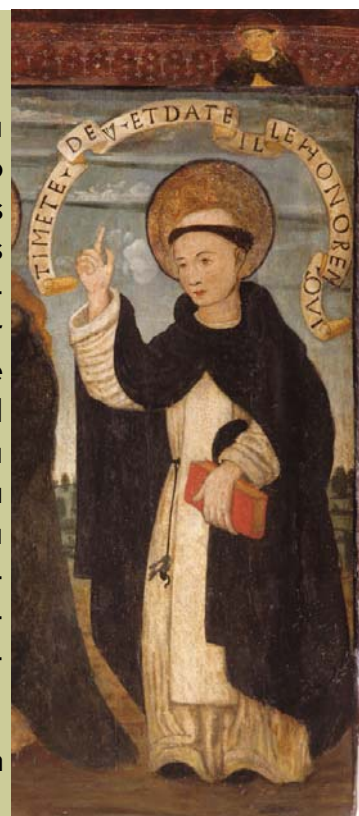
Anónimo, Virgen con el niño, San Vicente Ferrer, y San Jerónimo (detalle), siglo XVI, Museo Nacional de Cerámica.

Sin embargo por los motivos que se han aducido anteriormente en relación al encargo de la obra, el santo aparece aquí con el atuendo de beneficiado de la iglesia de Santo Tomás Apóstol. Viste un hábito negro con los puños y los bajos dorados. Por encima lleva un escapulario blanco decorado en la parte delantera con líneas verticales y horizontales y motivos vegetales en negro. El cuello y todo el perímetro del escapulario presentan una franja de encaje blanco. Sobre la cabeza luce un bonete negro. Aparece aureolado con una orla vegetal sobre la cual reposa una filacteria con la inscripción: "Timete Deum et date illi honorem quia venit hora iudicii eius" (Temed a Dios y honradle porque llega la hora de su juicio). Esta frase procede del Apocalipsis y la utilizaba el santo en sus sermones, lo cual explica que sea un elemento característico de su iconografía.