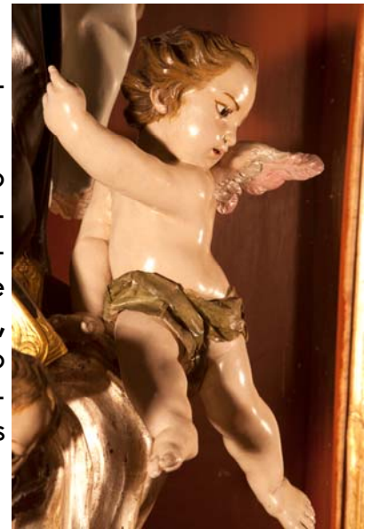
Detalle del ángel.