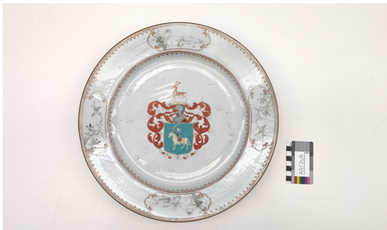
fig. 1. Fuente blasonada de porcelana china.

bre de 2022, apareció publicado en BOE (Núm. 217) la Orden CUD/860/2022, de 31 de agosto, por la que se ejercita el derecho de tanteo sobre el lote n.º 833, subastado por la Sala Durán Arte y Subastas, en Madrid, y se asigna al Museo Nacional de Arqueología Subacuática, por un precio de remate de 400 euros. Una vez que la fuente ingresó en el Museo se inscribió en el libro de registro de la colección estable con el número de inventario CE18160.