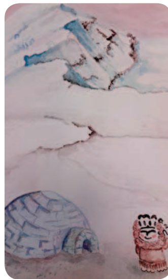
Qanik en la nieve.

*Reserva previa en reservas.mna@mecc.es a partir de las 9:00 h del 16 de junio. Sólo una familia por reserva. Todas las reservas realizadas tendrán que ser confirmadas por el museo a través del correo electrónico para tener validez. En las solicitudes de reserva se tendrá que facilitar el nombre de todos los miembros de la familia que desean participar en la actividad, la edad de los niños y un teléfono de contacto. Si por motivos de aforo de la actividad se agotaran las plazas y solo pudiera concederse todas las solicitadas, se informará de ello por correo electrónico.