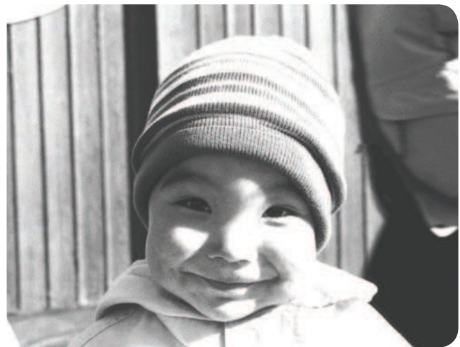
Niño inuit .

*Reserva previa en reservas.mna@mecd.es a partir de las 9:00h del 19 de mayo. Sólo una familia por reserva. Todas las reservas realizadas tendrán que ser confirmadas por el museo a través del correo electrónico para tener validez. En las solicitudes de reserva se tendrá que facilitar el nombre de todos los miembros de la familia que desean participar en la actividad, la edad de los niños y un teléfono de contacto. Si por motivos de aforo de la actividad se agotaran las plazas y solo pudiera concederse todas las solicitadas, se informará de ello por correo electrónico.