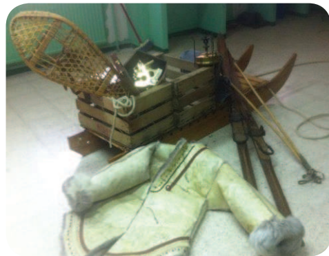
Objetos utilizados por los inuit .

confirmadas por el museo a través del correo electrónico para tener validez. En las solicitudes de reserva para dos niños, se tendrá que indicar expresamente y, en todo caso, facilitar el nombre de los niños para los que se desea reservar y un teléfono de contacto. Si por motivos de aforo de la actividad se agotaran las plazas y solo pudiera concederse la reserva de una sola de ellas y no de las dos solicitadas, se informará de ello por correo electrónico.