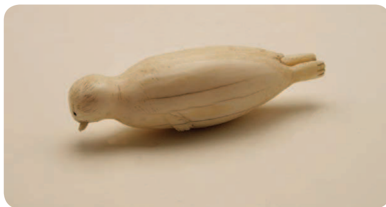
Figura de morsa. Inuit del Labrador. Finales del siglo XIX.

Si queréis pasar un rato divertido en el museo en familia y no tenéis todo el día... ¡esta es vuestra actividad! Pedid en taquilla este minikid/cuadernillo y recorred las salas de la exposición Los colores del Ártico y la sala de América en busca de los objetos de los que os iremos dando pistas e información según los vayáis encontrando. Con esta actividad, os sumergiréis en un mundo gélido pero maravilloso, de vastos horizontes y animales increíbles, y os inspiraréis con el ingenio de un gran pueblo como son los inuit del Polo Norte, a los que podréis conocer en este apasionante viaje. No os lo penséis más y venid al museo durante el verano, para quedaros ¡helados!