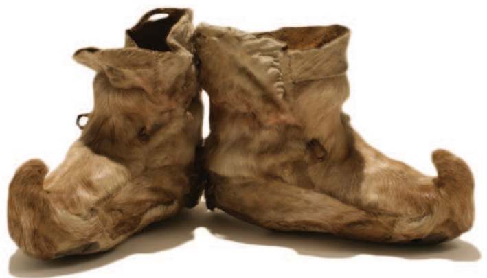
Botas saami hechas de piel de reno (Finlandia).