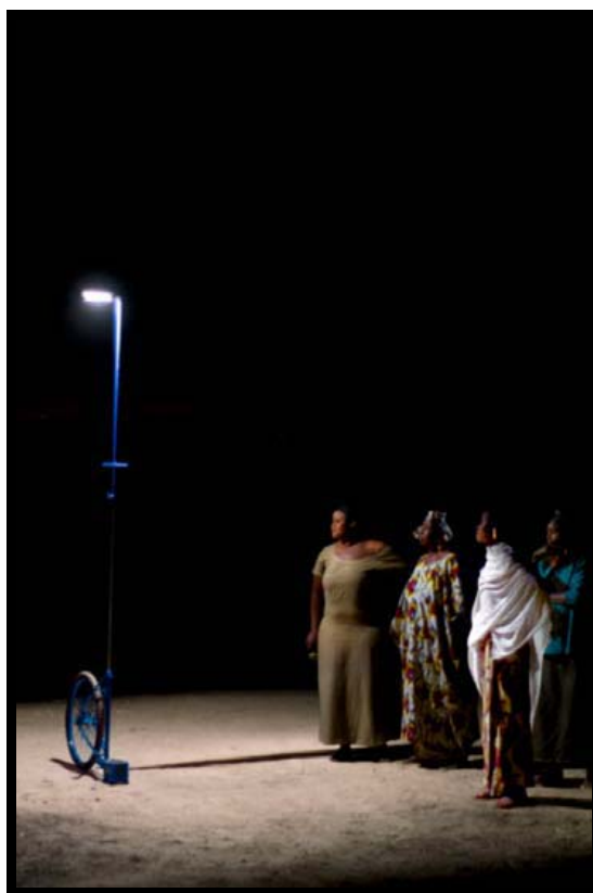
Mujeres mirando una farola del proyecto "Foroba Yelen".

Con la creación de estas luces se ha puesto en manos de cada comunidad un bien colectivo, gestionado por todo el grupo y en beneficio de todos, para la realización de actividades durante la noche como los trabajos en el molino, recolección de agua, alfabetización, comercio en carretera, partos, vacunación de animales, artesanía, además de rituales como bodas, funerales y entierros. Un proyecto este, llamado por los pobladores de la zona foroba yelen (luz Colectiva) o Wotoroyelene (el carro de la Luz), cuya importancia radica en haberse convertido en una herramienta común al servicio del trabajo, la educación y los rituales y que ha supuesto un gran impacto cultural, económico y social para las poblaciones donde han sido implantadas las farolas.