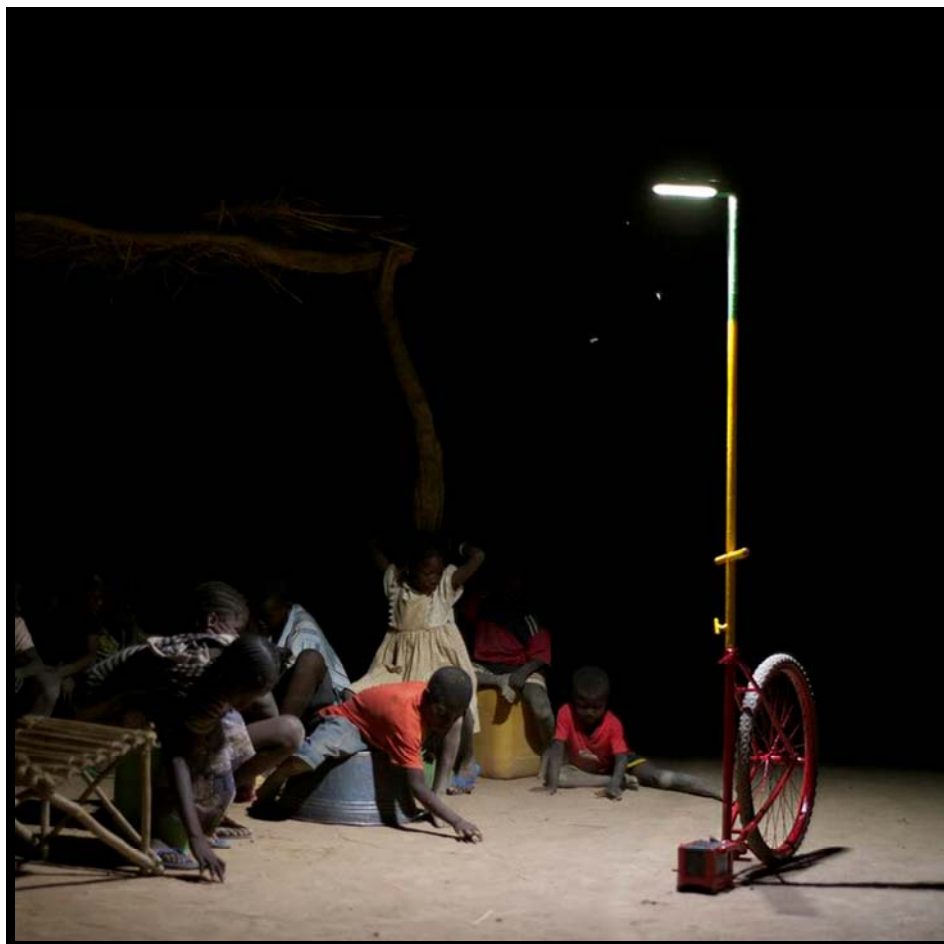
Niños jugando bajo la luz de una farola. Mali.

Foroba Yelen. Luz colectiva en el Mali rural.