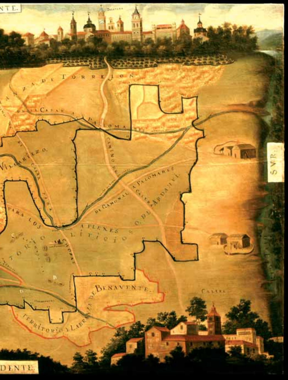
Fig. 9 Carta topográfica del territorio litigioso del Ardashí, delimitado por línea de mojonos, y próximo a Talavera de la Reina (Toledo). Segunda mitad del siglo XVIII. ARCHV, Planos y Dibujos. Óleos, 37.