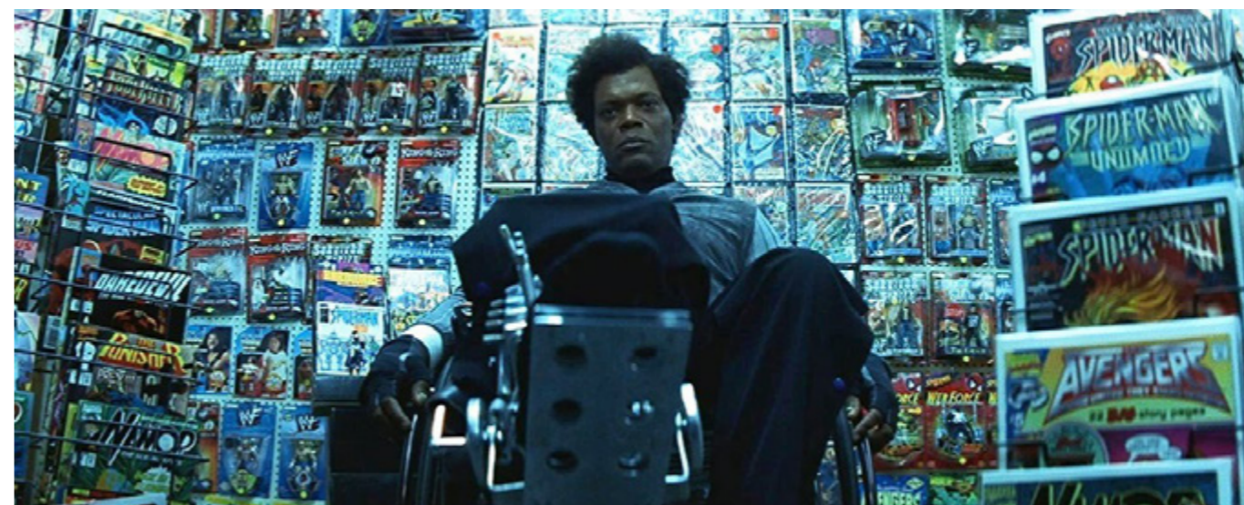
El protegido (M. Night Shyamalan, 2000)

El viernes 1, de 18:00 a 19:00, Radio 3 visita el vestíbulo del Doré para grabar con música en directo su espacio de cine y audiovisual, Tres en la carretera , dirigido y presentado por Isabel Ruiz Lara, que se emite los sábados y domingos de 15:00 a 16:00.