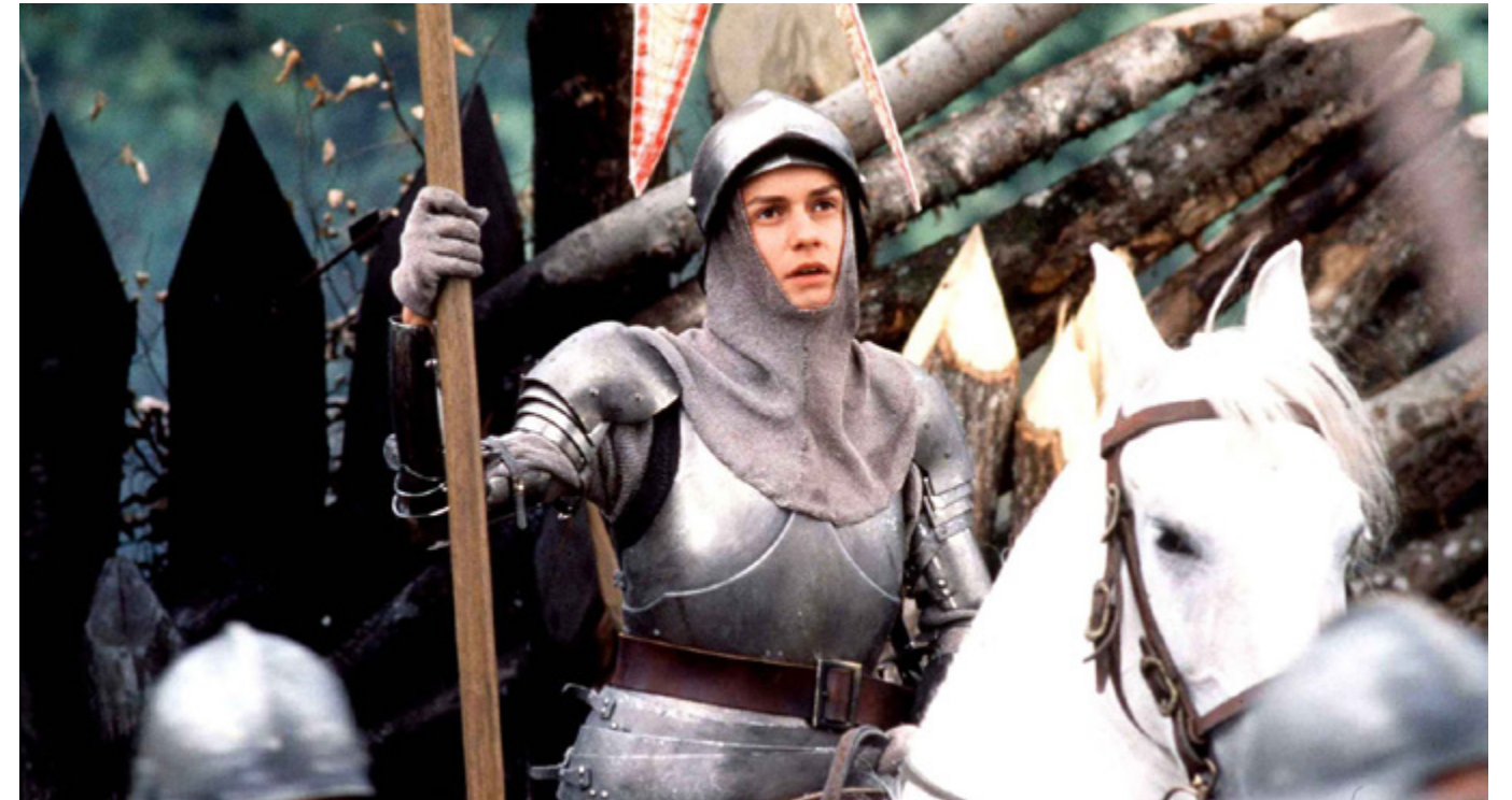
Jeanne la Pucelle I - Les batailles