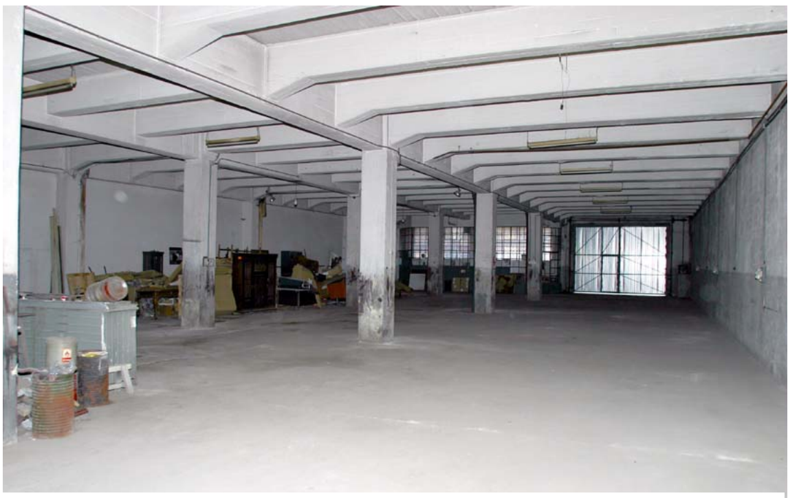
Estado anterior a la reforma.

No se han introducido modificaciones que alteren la configuración del edificio ni su organización general.