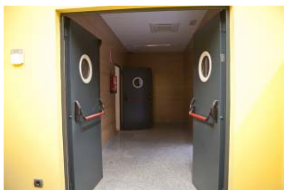
Sectorización en depósitos.