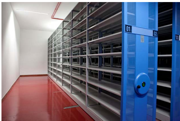
Vista de los compactos.