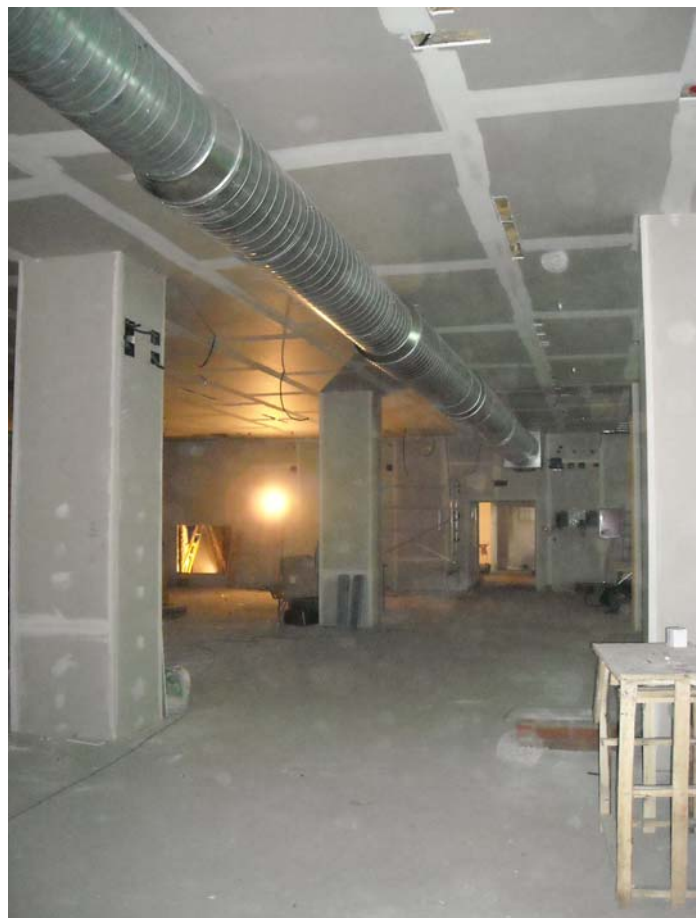
Estado de la obra con terminaciones de solera, revestimiento de pilares, falsos techos, instalaciones de electricidad y climatización.

Debido a la excesiva altura del local y por existir vigas de cuelgue de gran canto, y además con el fin de conseguir la iluminación idónea, se procedió a disminuir la altura del techo con placas de distintos materiales y asilamiento según el uso de cada dependencia.