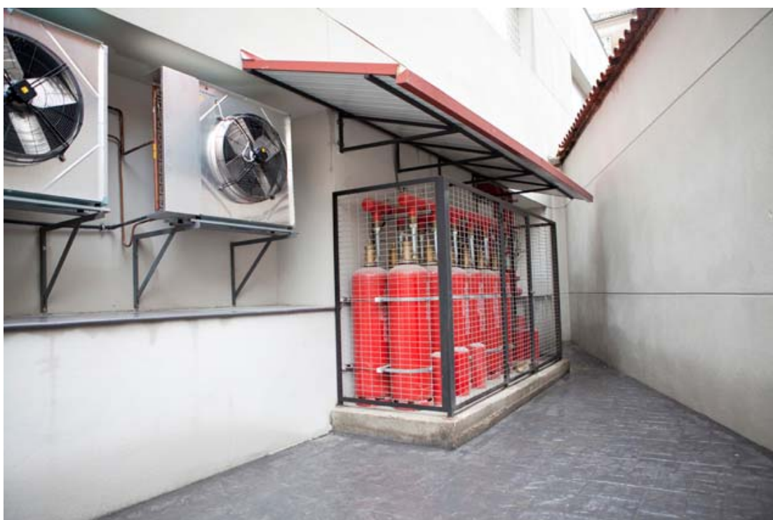
Instalaciones de protección de incendios y de climatización.

Dada la importancia de los documentos a almacenar se ha realizado una instalación de sistema de detección anti-intrusos, con incorporación de sistema de circuito cerrado de televisión, centralizada a través del servicio de vigilancia del edificio principal del Archivo.