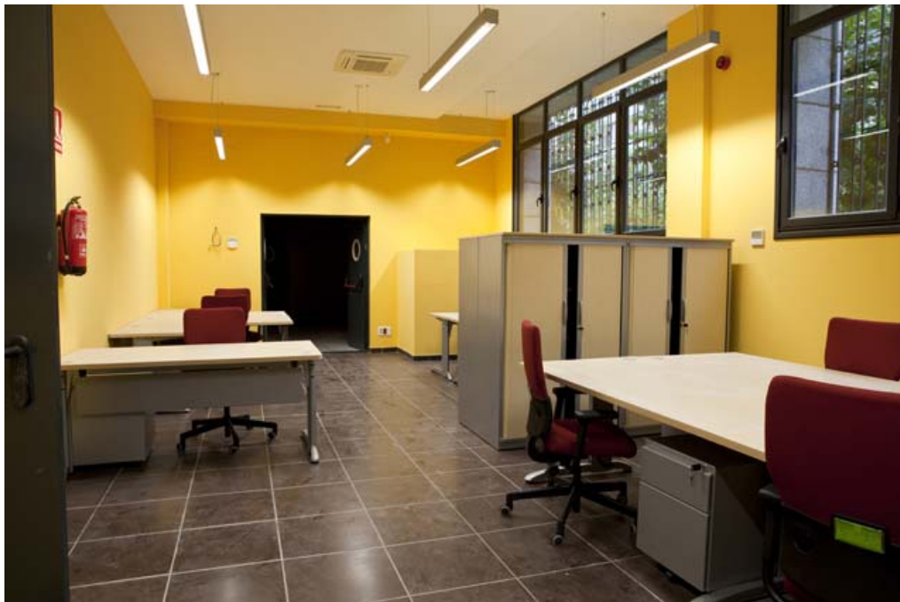
Zona de trabajo y administración.

Con la intervención se ha obtenido un espacio de 1.607,70 m 2 útiles, de los que 263,90 se destinan a zona de administración y recepción de documentación, disponiendo de dos depósitos independientes y protegidos de 493,30 y 543,00 metros cuadrados respectivamente, además de espacios de instalaciones y servicios de personal. Se consiguen aproximadamente 18 kilómetros de estanterías.