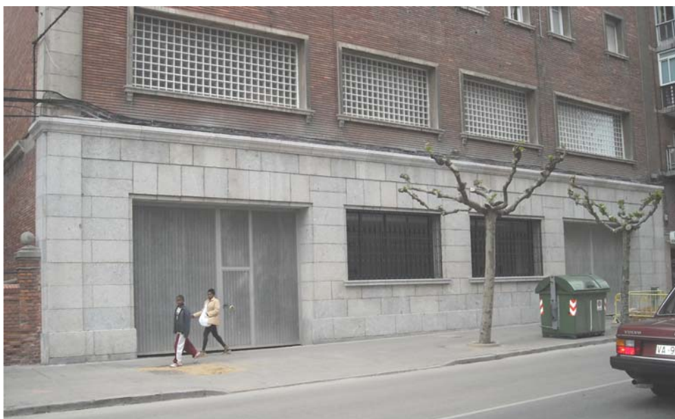
Fachada del acceso a la ampliación del Archivo. Estado previo.

El Ministerio de Cultura a través de la Gerencia de Infraestructuras y Equipamientos, convoca el 16-4-2008, un concurso público para el acondicionamiento del local. Resulta adjudicataria la empresa constructora DECOLESA con una oferta de 999.011,57 euros, firmándose el contrato de las obras el 20-8-2008 y siendo el 9-9-2008 la fecha de la firma del Acta de comprobación del replanteo.