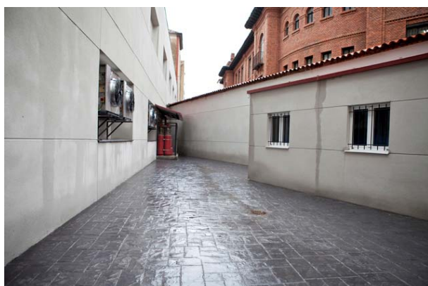
Estado del patio.

Fecha de inicio : Septiembre 2008 Fecha final de obra : Mayo 2009