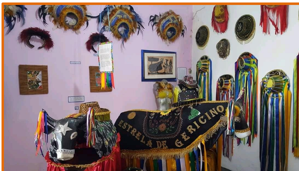
Sala en la que se muestran piezas realizadas en los talleres de costura y artesanía del museo.

El Museu Casa do Bumba Meu Boi em Movimento Raízes de Gericinó es fruto de la lucha por el derecho a la vivienda en Catiri, un suburbio carioca formado por migrantes del nordeste de Brasil. El grupo que dio origen al museo, “Estrela de Gericinó”, quería reinventar en Catiri la cultura del Bumba meu boi (“Golpea mi buey”), una manifestación teatral de esa región que incluye música y danza, con distintos personajes, entre los que destaca un buey que muere y vuelve a la vida. Nuestra matriarca, Doña Rosa, es una fiel transmisora de esa tradición marañense.