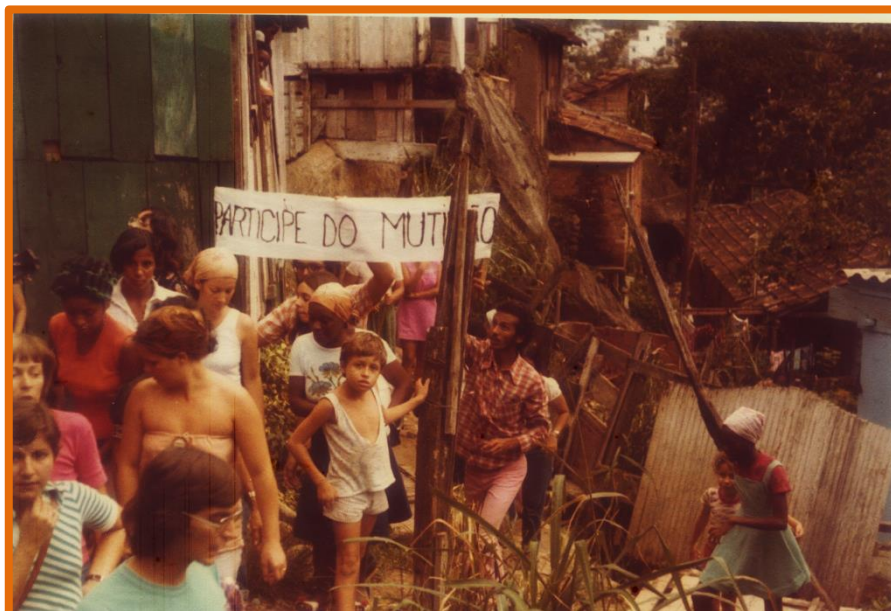
Lucha de las vecinas y vecinos de la favela Rocinha por el derecho al saneamiento básico.

En el Museu Sankofa , estimulamos el debate comunitario en torno a la memoria, el patrimonio, el medio ambiente y las condiciones urbanas de las favelas, y apoyamos acciones culturales, socioeducativas, ambientales y de derechos humanos. También organizamos cursos y exposiciones abordando temas de interés para las vecinas y los vecinos de la Rocinha.