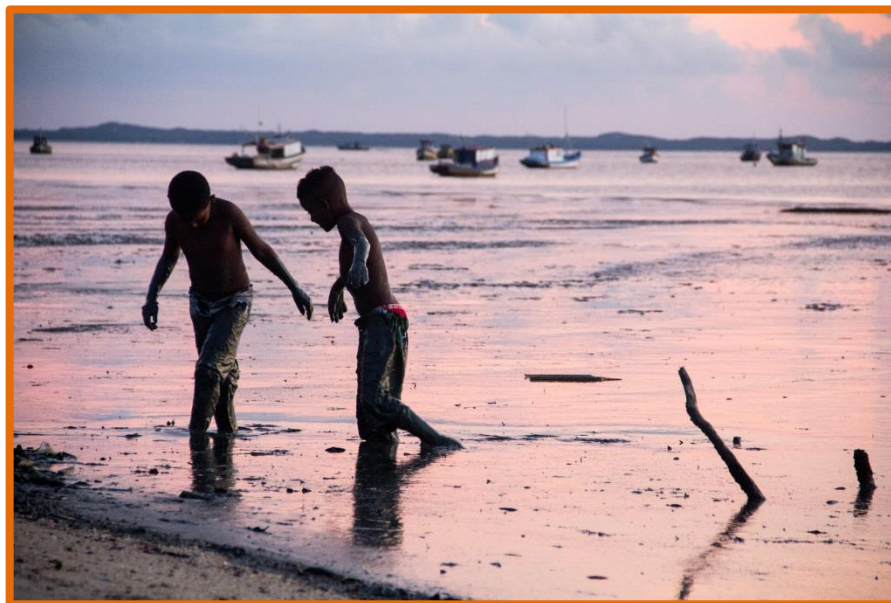
Época de cometas. Fotografia: Daniel Barreiros, 2017.

Organizamos y promovemos rutas para que las y los residentes reconozcan y redescubran su identidad y su patrimonio; y diferentes actividades de educación patrimonial y ambiental. La propia comunidad decide cuál es su patrimonio cultural.