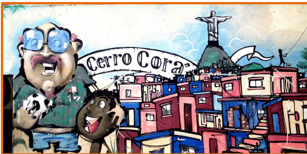
Arte urbano en Cerro Corá.

Memórias do Cerro Corá nace en 2013 como un proxecto para recoger fotografías antigas de la favela Cerro Corá. Vecinas y vecinos nos prestaron sus fotografías para que las digitalizáramos. El 18 de agosto de ese año organizamos una exposición en la que pudieron contemplar sus fotografías ampliadas. Estas fotografías pasaron a formar parte de la colección del museo, a las que se han sumado fotografías actuales, ahora cuenta con cerca de 2.000.