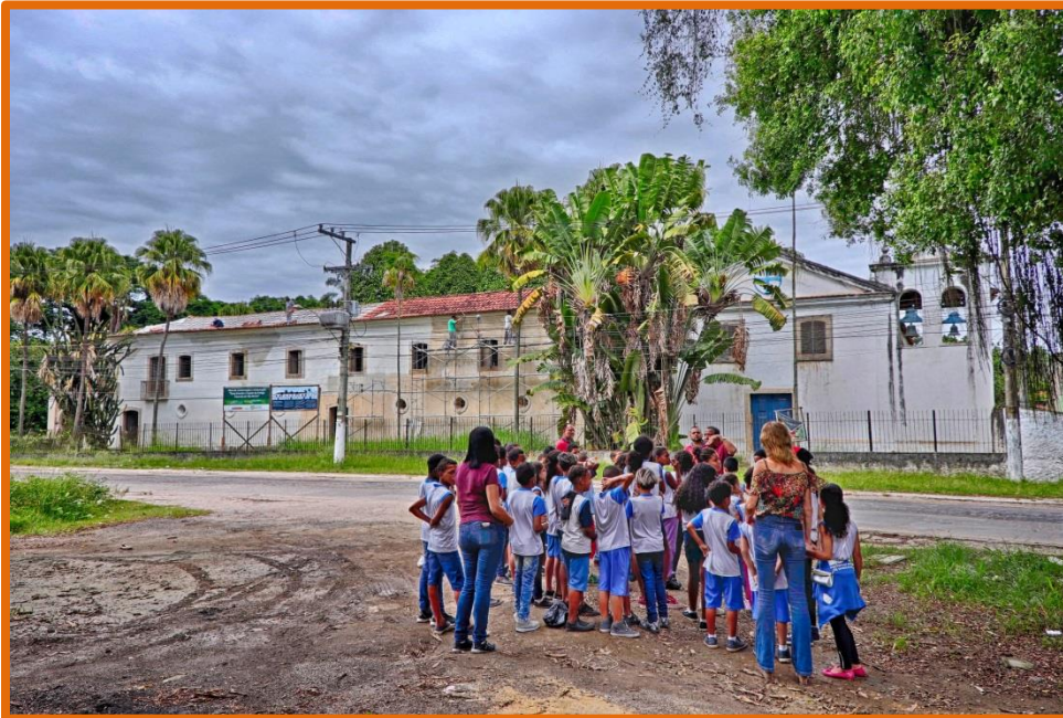
Grupo escolar en la Capilla de Nossa Senhora do Rosário dos Homens de Cor.