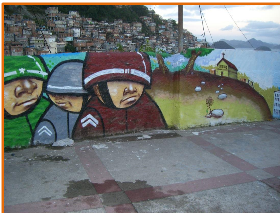
Limite da Força, Igreja e Exército (“Límite de fuerza, iglesia y ejército”), es uno de los grafitis del circuito “Casas-Tela. Caminos de vida del Museu de Favela”, de los artistas Bob, Emol y Acme.

El Museu de Favela (MUF) es una ONG comunitaria de las favelas de Pavão, Pavãozinho y Cantagalo. Inauguramos el museo en febrero de 2009 en un gran evento cultural comunitario. Desde entonces, la población que reside en estas favelas vive dentro de un museo: ¡el primer museo territorial integral de la favela!