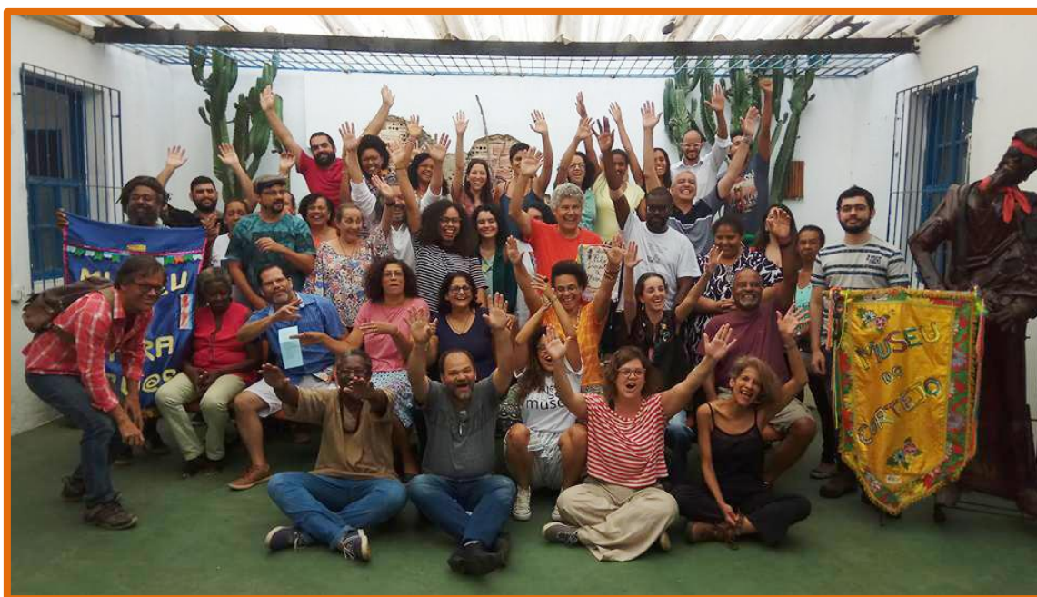
Encuentro de la Rede de Museologia Social do Rio de Janeiro en el Museu Vivo do São Bento (2017).

Hemos puesto en marcha para ello Démosle la vuelta al mundo , un ciclo integrado por al menos siete exposiciones o “paradas” sucesivas a lo largo de los tres años del quinto centenario. La primera de esas paradas la realizamos en el lugar de América en que, tras la travesía del Atlántico, la expedición fondeó a finales de 1519 y a partir del que fue costeando hacia el sur a la búsqueda del deseado paso hacia las “Indias Orientales”. Nos referimos a la Bahía de Guanabara, en cuyo seno unas décadas más tarde los portugueses fundarían la ciudad de São Sebastião do Rio de Janeiro.