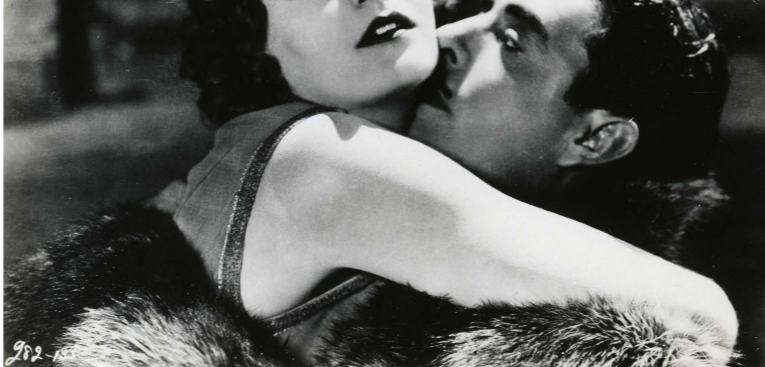
Greta Garbo en Flesh and the Devil (El demonio y la carne) , Clarence Brown, 1926)