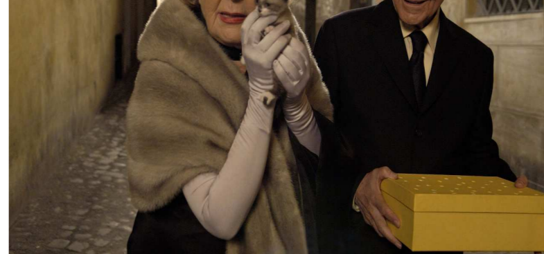
Manuel Alexandre y China Zorrilla en Elsa & Fred (Marcos Carnevale, 2005)