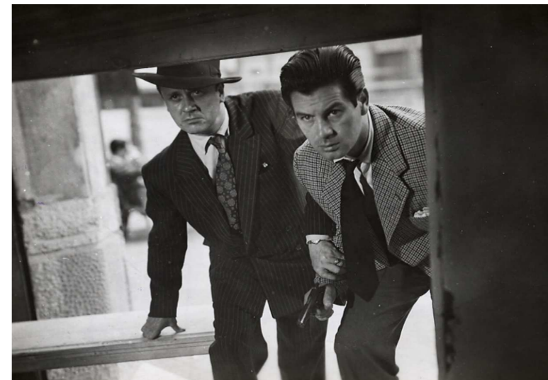
Brigada Criminal (Ignacio F. Iquino, 1950).

SRFI/E* Sonorizada con rótulos en francés, inglés y español electrónico