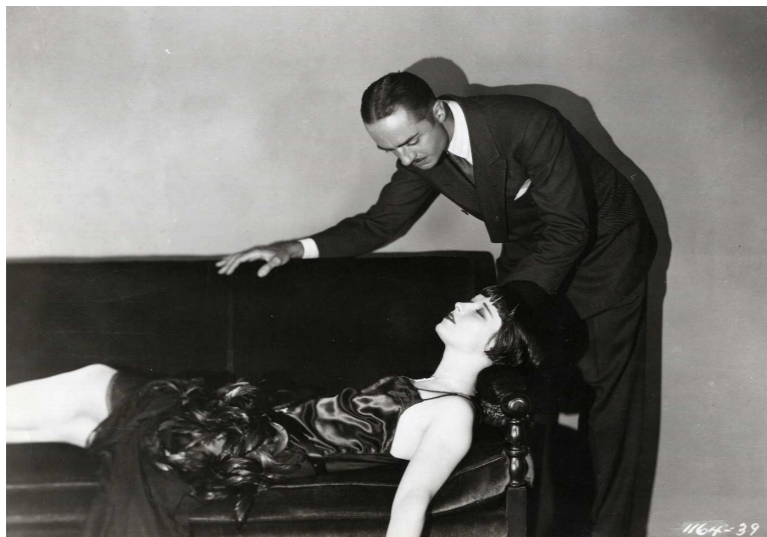
Louise Brooks en The Canary Murder Case (¿Quién la mató? Malcolm St. Clair Frank Turrtle, 1929).

Las sesiones anunciadas pueden sufrir cambios debido a la diversidad de la procedencia de las películas programadas.