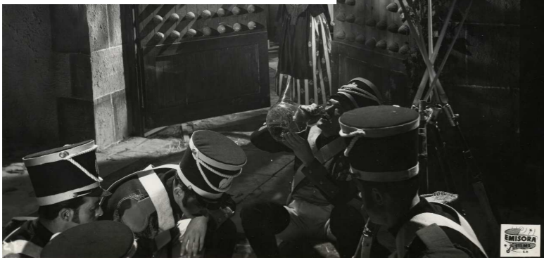
Ana Mariscal en El tambor del Bruch (Ignacio F. Iquino, 1948)