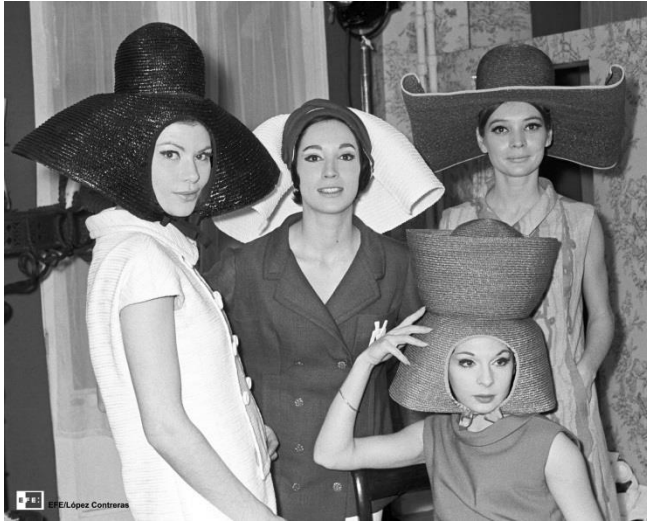
Modelos durante un desfile de la firma Vargas Ochagavía | Madrid, 1965 | EFE | Manuel López Contreras.