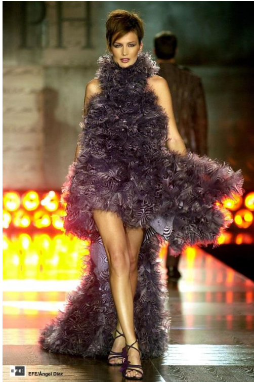
Nieves Álvarez en un desfile de Pedro del Hierro para el Otoño-Invierno 2003, en la Pasarela Cibeles | Madrid, 2002 | EFE | Ángel Díaz | Fotografía digital.