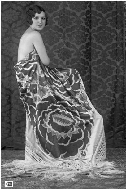
Retrato de mujer con un mantón de Manila | Madrid, 1932 | EFE | Placa de vidrio.