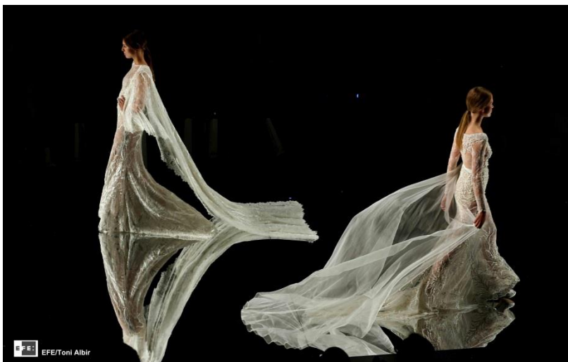
Desfile de novias de Yolancris, en la Barcelona Bridal Week | Barcelona, 2015 | EFE | Toni Albir | Fotografía digital.