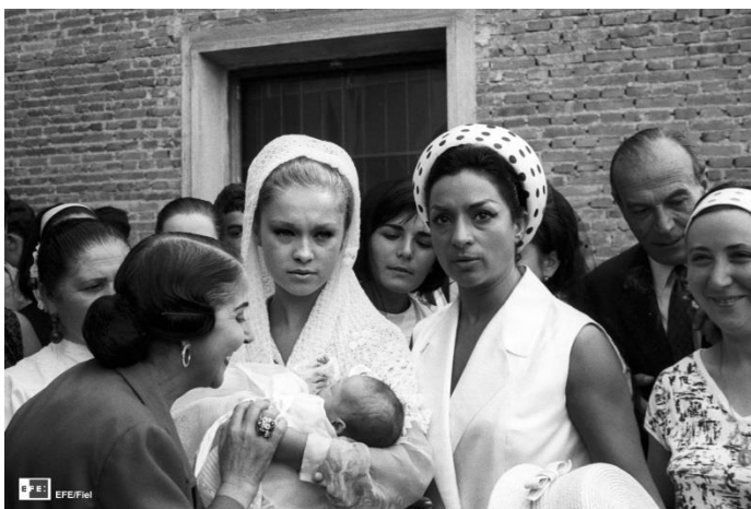
La cantante Marisol, junto a Lola Flores (dcha) y Estrellita Castro (izq) en el bautizo del hijo de Carmen Sevilla y Augusto Alguero | Madrid, 1964