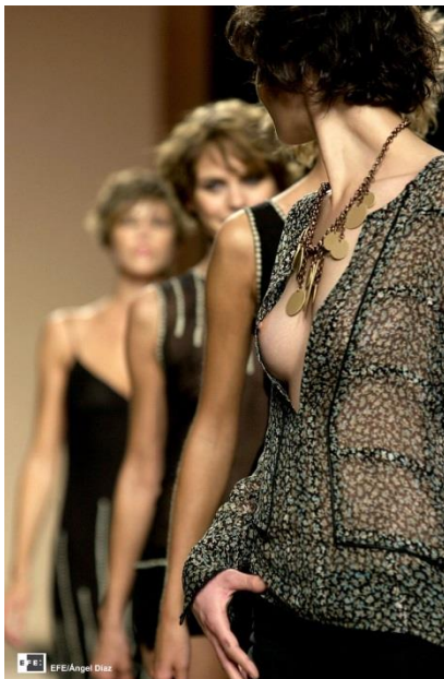
Desfile de Jorge Vázquez para la Primavera-Verano 2003, en la Pasarela Cibeles | Madrid, 2002 | EFE | Ángel Díaz | Fotografía digital.