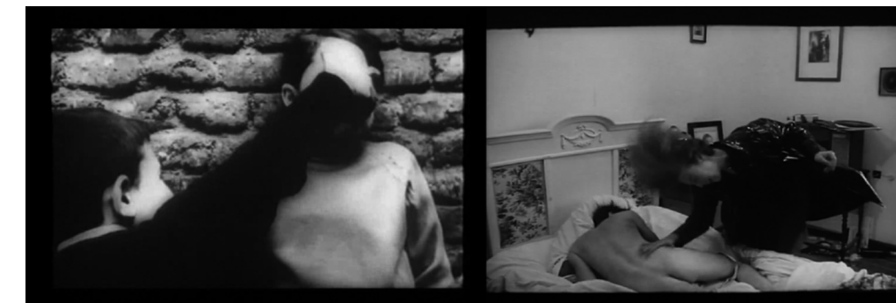
Figs. 1 y 2: sadismo y sexualidad en Ágata e Ida y vuelta .