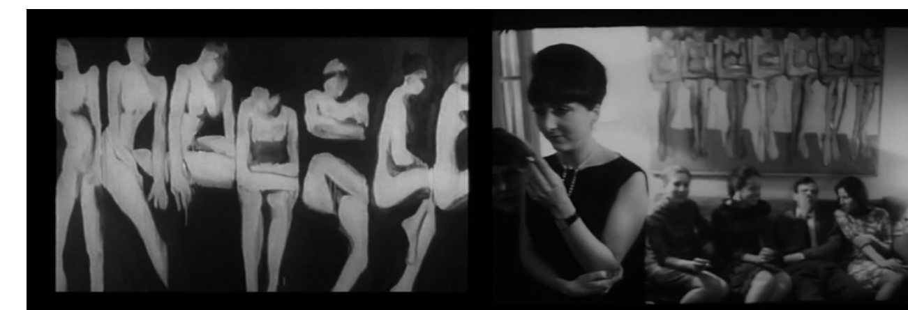
Figs. 3 y 4: Fórmulas de representación de lo femenino y continuidades pictóricas en Ágata e Ida y vuelta .

Dentro de ese ensanchamiento de lo decible que destacaba Asier Aranzubia, en la hoja de sala del “Doré en casa” dedicada a Soy leyenda (Mario Gómez Martín, 1967), como una de las características de las producciones de la E.O.C., tanto por quedar, como prácticas de escuela, al margen del circuito de exhibición público y de la censura, las dos películas de Zulueta aquí presentadas son ejemplos de un cine que encontrará sus mejores exponentes en las rupturas del cine de los sesenta (dentro y fuera de España) y en las producciones, por ejemplo, de los setenta de Adolfo Arrieta, Antoni Padrós o, por supuesto, el propio Zulueta.