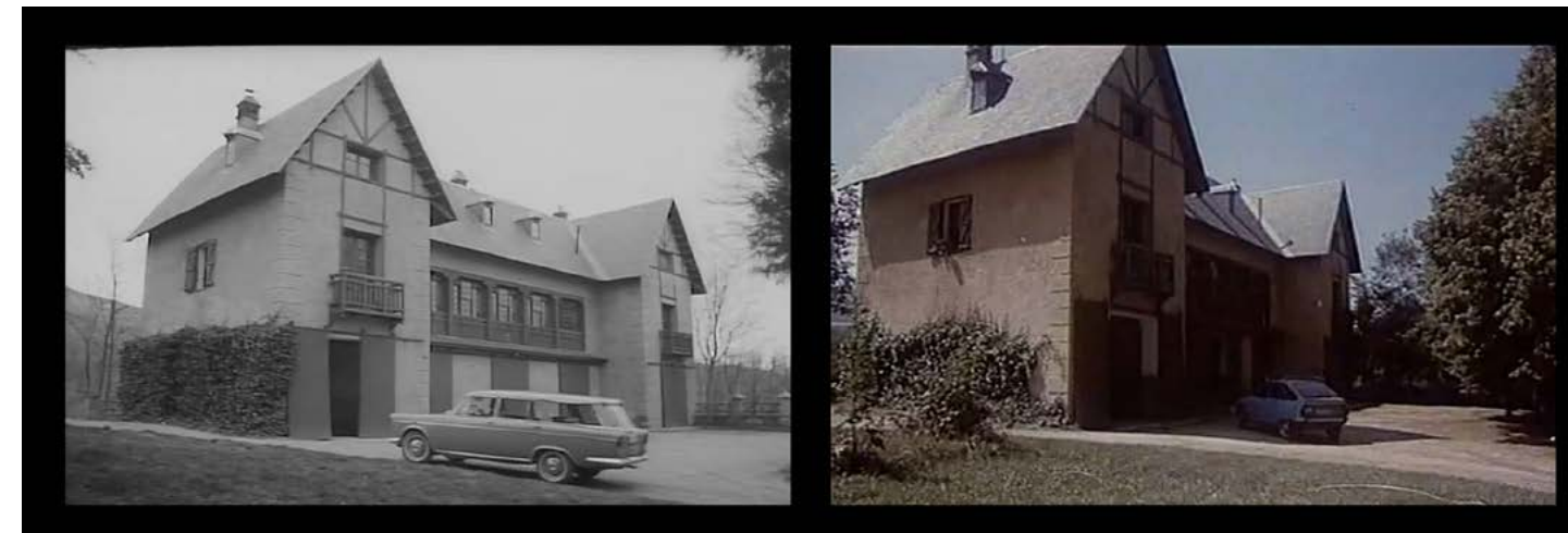
Figs. 7-12: Conexiones cinéfilas y rimas espacio-temporales en el cine de Zulueta. La finca de la Mata como extensión de una subjetividad en tránsito en los viajes de Elena en Ida y vuelta (I. Zulueta, 1968) y las visitas de Jose Sirgado a Pedro en Arrebato (I. Zulueta, 1979).

La sesión dedicada a Iván Zulueta se podrá ver online del 8 al 12 de mayo a las 12:00. Pulsa sobre el enlace para verla: