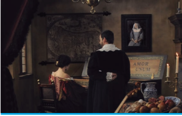
Imagen de portada: Fotograma de Master and Commander: Al otro lado del mundo (Peter Weir, 2003)