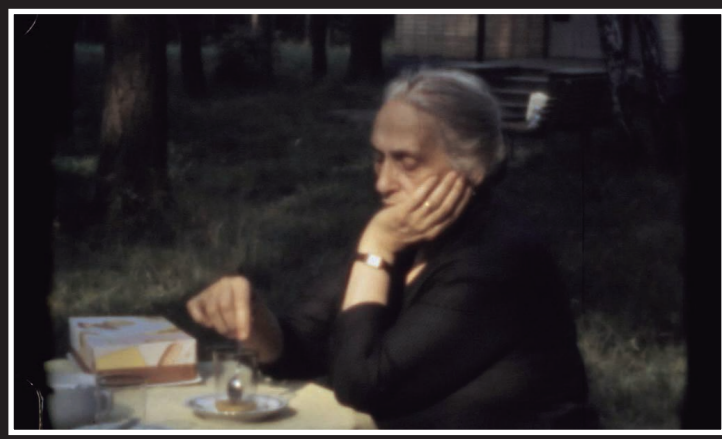
Diarios del exilio (Irene Gutiérrez, 2019)