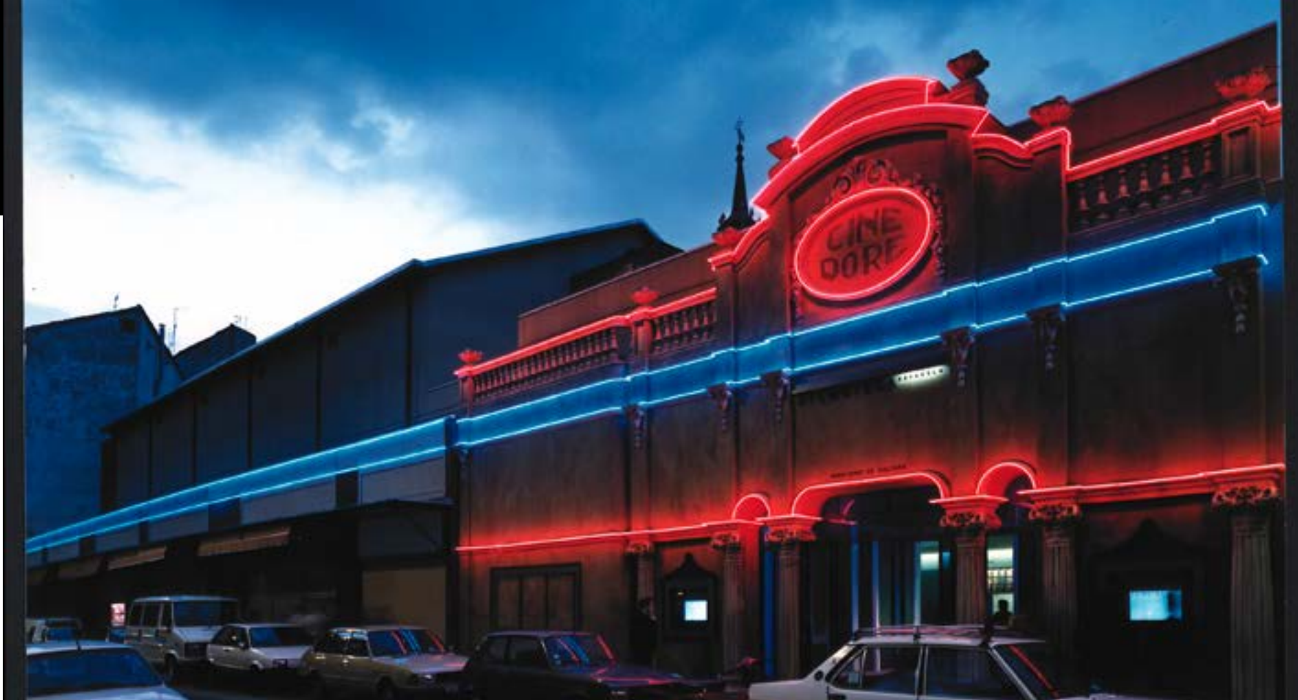
La fachada del Cine Doré en 1989.