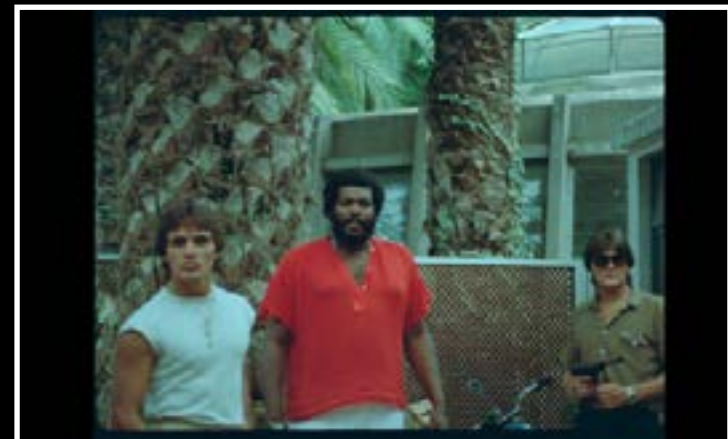
Vaya luna de miel (Jesús Franco, 1980)