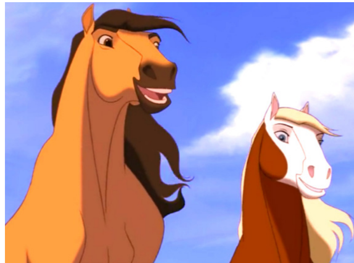
Spirit: el corcel indomable