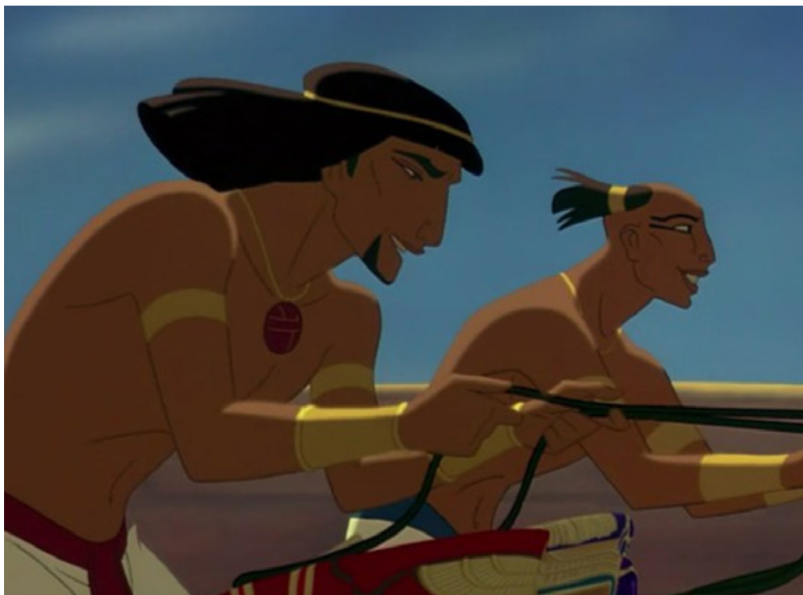
El príncipe de Egipto

Su departamento de animación no solo no era ajeno a esta búsqueda, sino que participó activamente en ella.