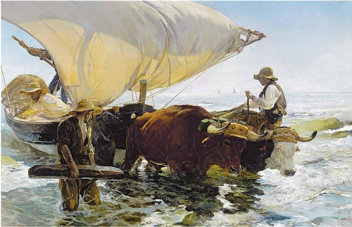
Joaquín Sorolla Bastida, La vuelta de la pesca , 1894, París, Musée d'Orsay, inv. R. F. 948; P 1032; BPS 729.