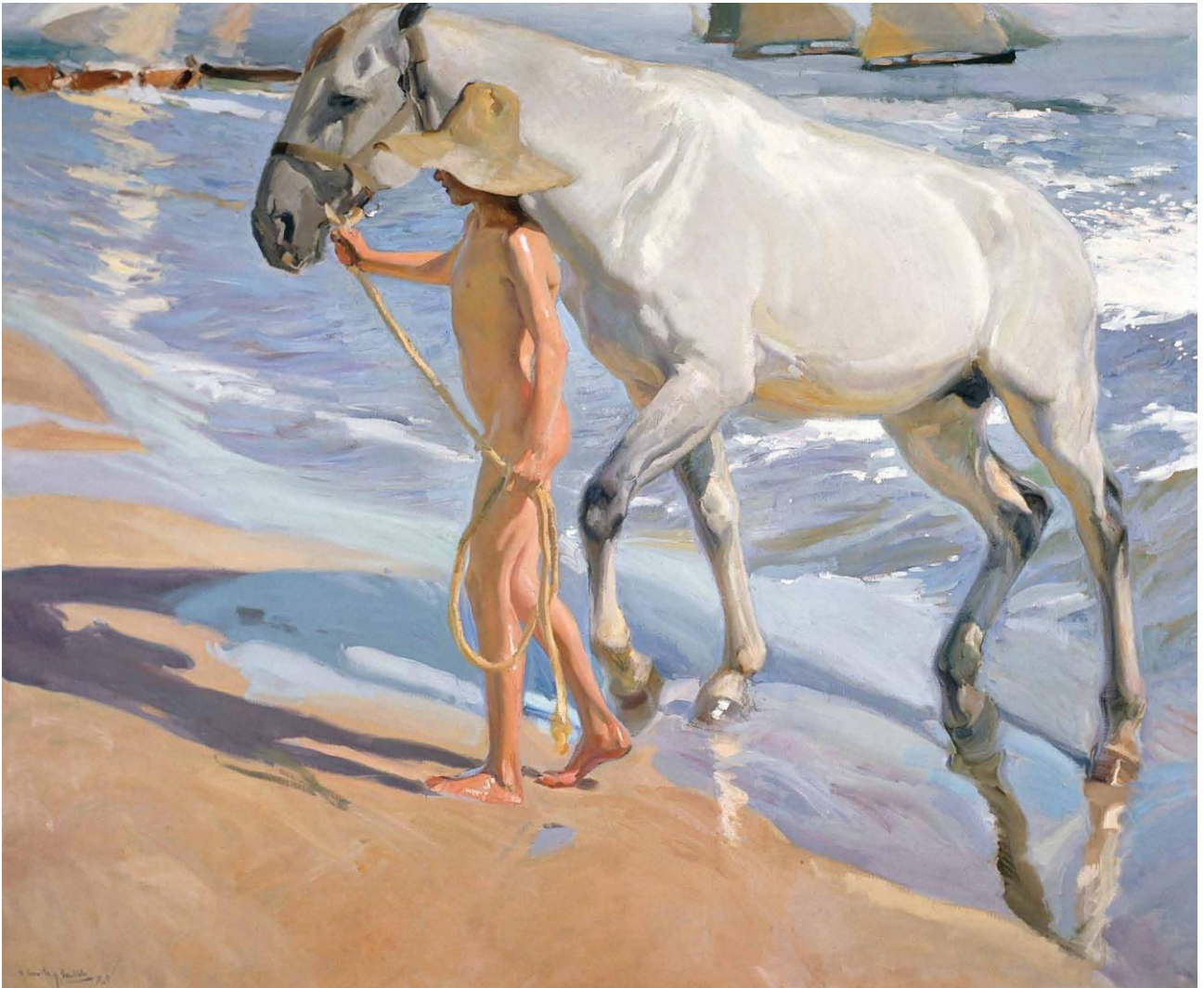
Joaquín Sorolla Bastida, El baño del caballo , 1909, Museo Sorolla 839.

Su último gran encargo le ocuparía los últimos años de su vida. El proyecto “Visión de España” para la Hispanic Society de América, fundada por el hispanista y filántropo Archer Milton Huntington, llevó al pintor a viajar sin parar por distintas regiones del país: Castilla, País Vasco, Andalucía, Valencia, Extremadura... Estas últimas obras se inauguraron en Nueva York en 1926, tres años después del fallecimiento del artista.