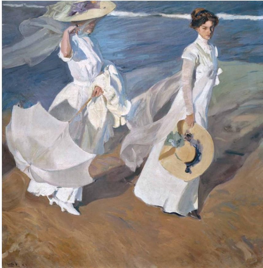
Joaquín Sorolla Bastida, Paseo a la orilla del mar , 1909, Museo Sorolla, n.º inv. 834.