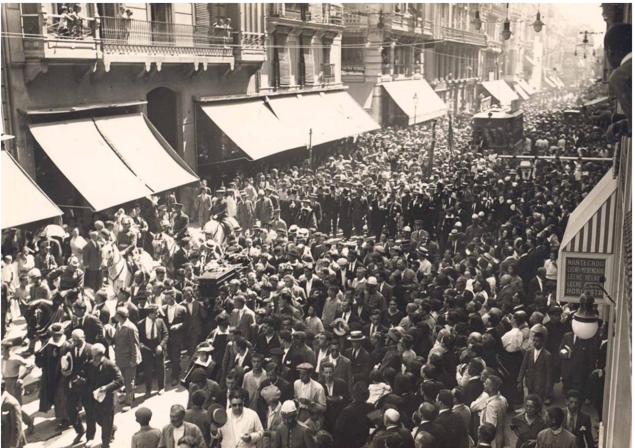
Campúa [José Demaría López] (atribuido a), Paso del cortejo fúnebre de Sorolla por las calles de Valencia , 13 de agosto de 1923. MS 80804.