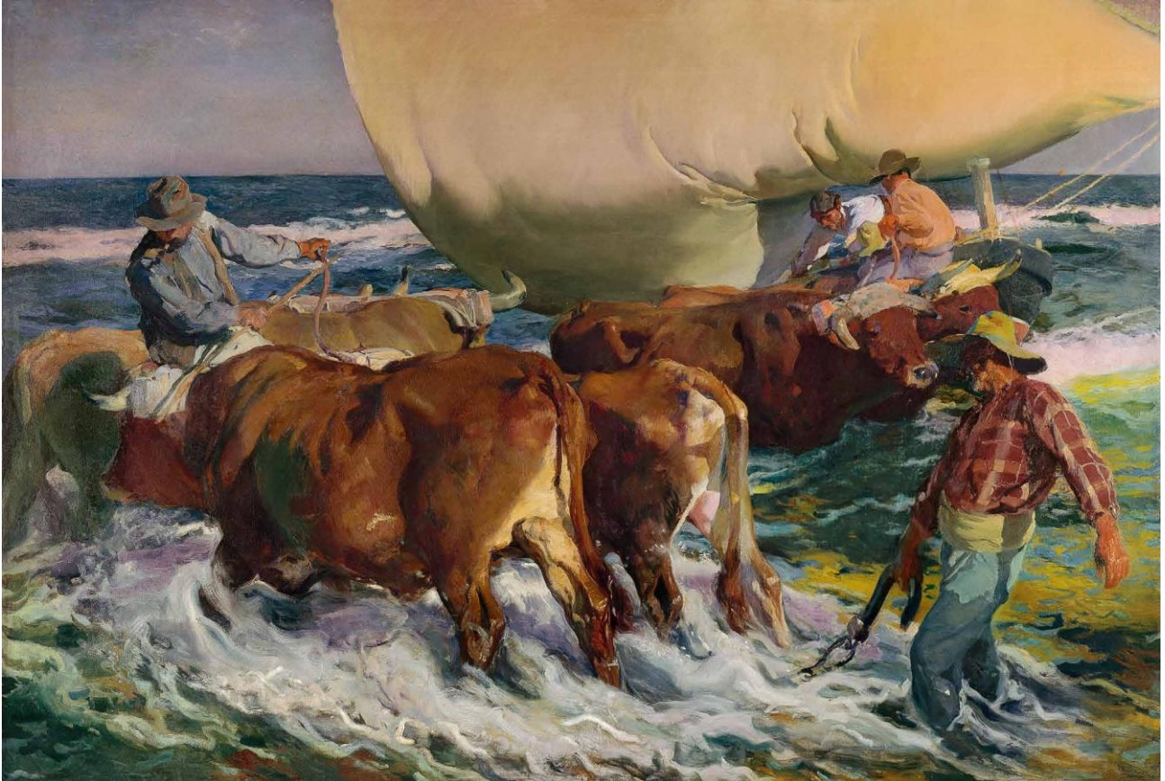
Joaquín Sorolla Bastida, Sol de la tarde , 1903, Hispanic Society of America, BPS 1449.

Seguro ya de su pintura pudo centrarse entonces en el arte, la luz y el color. Pintó Sol de tarde en 1903 en las playas de Valencia. Allí, el sol espléndido, el bullicio del trabajo, del juego, inspiraron al pintor para trabajar en obras llenas de luz y de vitalidad que pronto se convirtieron en lo más destacado de su producción. Especialmente bellas son las pinturas realizadas en Jávea, llenas de movimiento y de reflejos, de juegos pictóricos y transparencias.