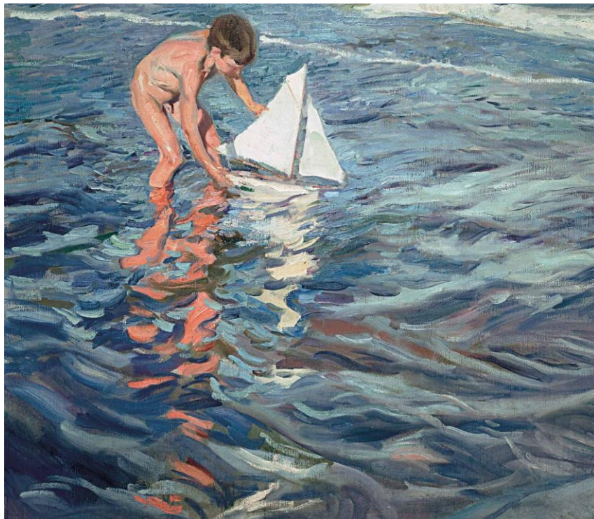
Joaquín Sorolla Bastida, El baño del caballo , 1909, Museo Sorolla 839.