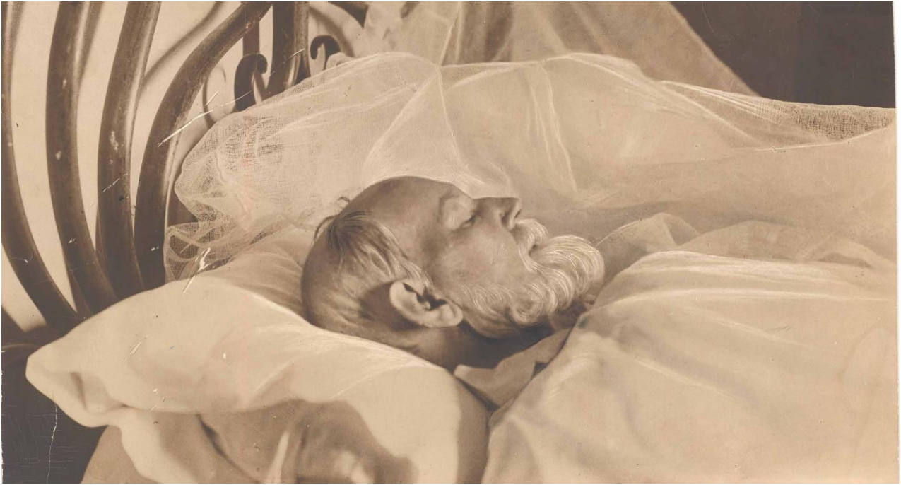
Alfonso Sánchez Portela, Lecho mortuario de Sorolla , 11 de agosto de 1923, Museo Sorolla, n.º inv. 80735.

Joaquín Sorolla Bastida falleció el 10 de agosto de 1923 en Cercedilla (Madrid). La noticia de la muerte del maestro corrió como la pólvora. Se avisó a familiares, amigos y conocidos, a las autoridades valencianas y al Rey Alfonso XIII, que se encontraba en Santander, y quien contestó a la familia con un sentido telegrama de pésame.