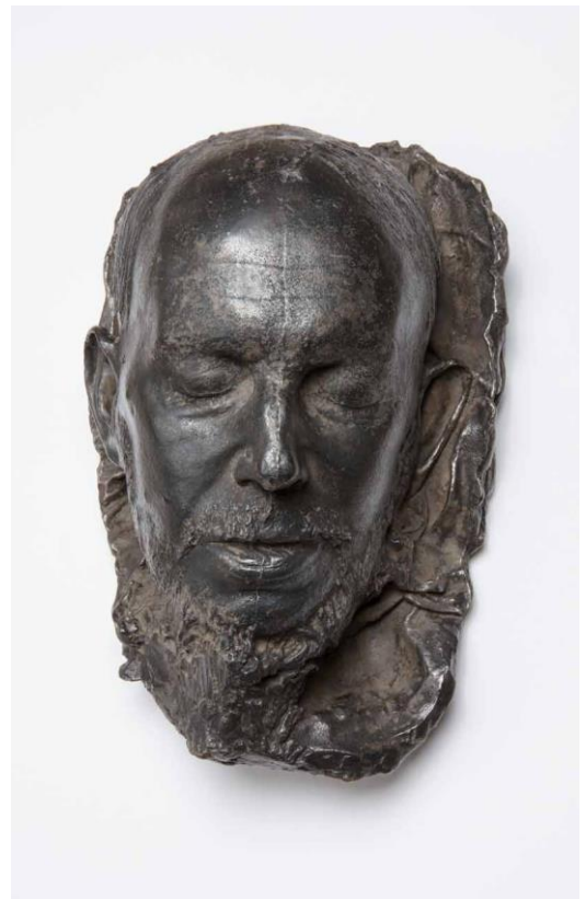
Mariano Benlliure, Máscara mortuoria de Joaquín Sorolla Bastida . ca. 1923. Fundación Museo Sorolla, n.º inv. 20328.

La capilla ardiente se instaló en su casa de Madrid, hoy Museo Sorolla. Desde allí iniciaría su marcha la comitiva fúnebre que recorrió las calles de la ciudad hasta la estación del Mediodía (hoy Atocha) –deteniéndose frente al Museo de Arte Moderno, donde se realizó un responso al pintor–. A su llegada a Valencia, una multitud acompañó al féretro sonando los acordes de la Marcha Real interpretada por una compañía del regimiento de Mallorca. Sorolla fue enterrado en su ciudad natal con honores de capitán general con mando en plaza. Su familia y amigos le lloraron desconsolados. Y el pueblo entero acudió a despedirle.