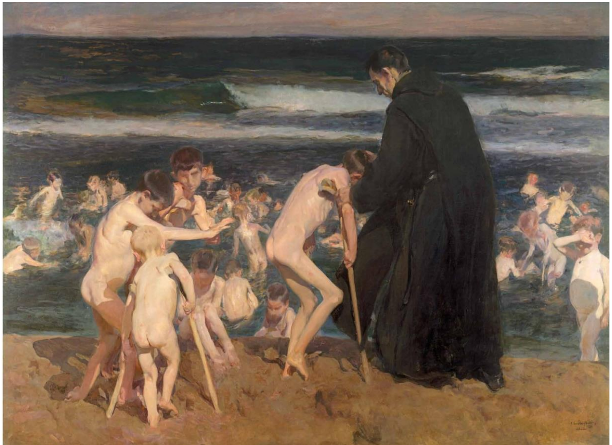
Joaquín Sorolla Bastida, ¡Triste herencia! , 1899, Fundación Bancaja, P 1050; BPS 807.