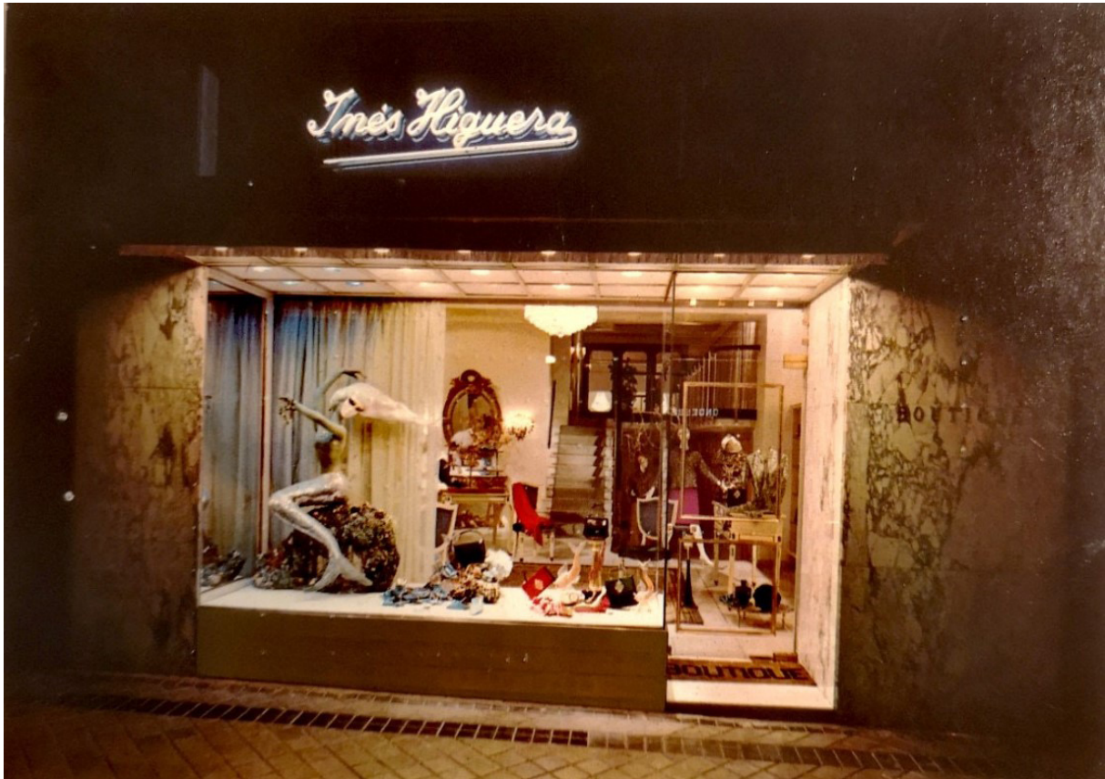
Figura 3. Tarjetón de la boutique Inés Higuera, calle Serrano, 76. Década de 1960.

años conserva el Guardarropa de concierto de Teresa Berganza (en adelante, GCTB) dos cuerpos bordados sin etiqueta, con calidad de alta costura.