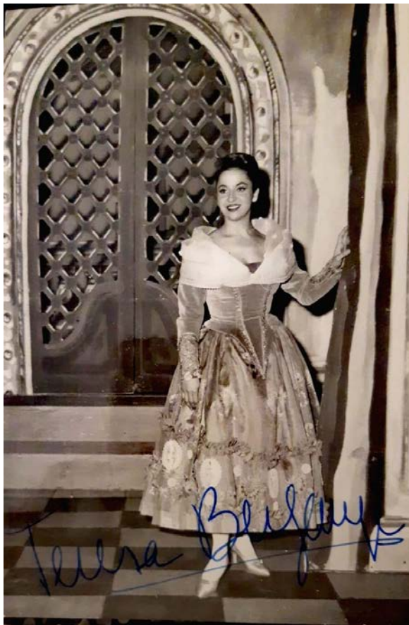
Figura 1. Fotografía de Teresa firmada en los años 1960.

El debut de Berganza tuvo lugar en la década de 1950 en España, Italia y Francia, países en los que la cantante