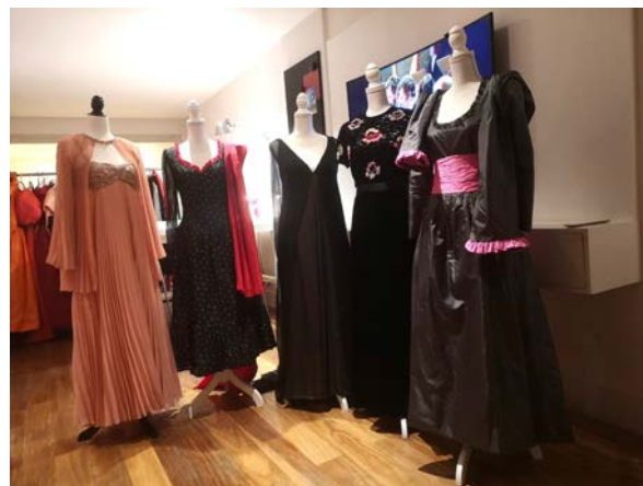
Figura 5. Modelos con etiqueta Inés Higuera, década de 1970. GCTB.

Desde el inicio de su vida en el canto, Berganza siempre llevó por todo el mundo el repertorio de zarzuela, contando en su discografía con una profusa colección que abarca todos los títulos principales de Chueca, Giménez, Luna, Bretón, Chapí, Sorozábal. Además, tuvo desde siempre un idilio con el repertorio de Manuel de Falla, cuyas óperas y canciones interpretó y grabó en muchas ocasiones. En los años 70 siguió con ese repertorio español y también con repertorio francés, el rol de Carmen en la ópera de Bizet desde 1977 en el festival de Edimburgo y el papel de Charlotte en el Werther de Massenet desde 1979. Esa ampliación en su repertorio parece tener reflejo en su vestuario de concierto y de calle, pues, aun siguiendo las modas, el estilo de Berganza era muy personal. Empezamos a ver colores más sólidos, modelos que citan el arte barroco español y las guarniciones de volantes, faldas menina, mangas farol,