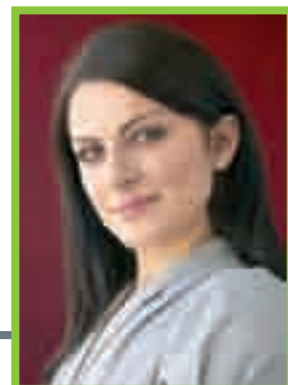
Cortésía: Alexandra Nechita

"Lo importante es la emoción o la sensación que algo te provoca; eso es lo que terminas por pintar, y no el objeto en sí. Si yo estoy pintando una lámpara, estoy pintando lo que esa lámpara significa para mí." (Alexandra, en una entrevista para el Orange County Register , en junio de 2003).