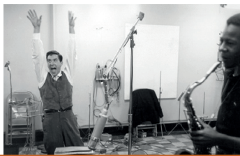
High School (Frederick Wiseman, 1968)