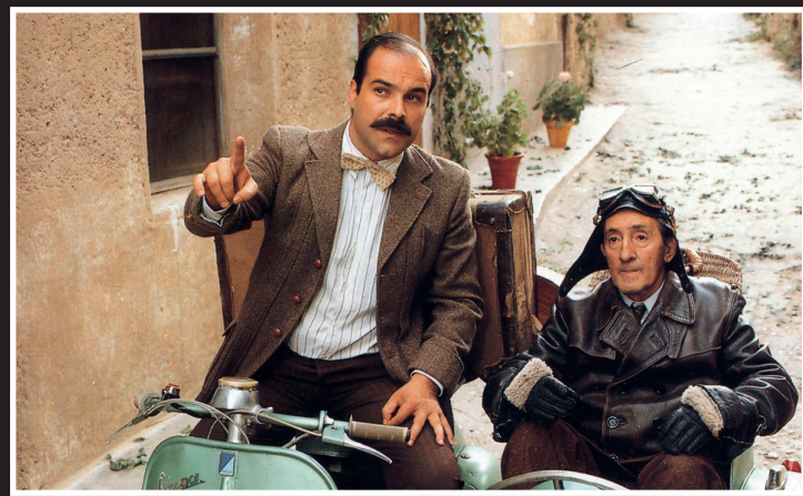
Amanece, que no es poco (José Luis Cuerda, 1989)