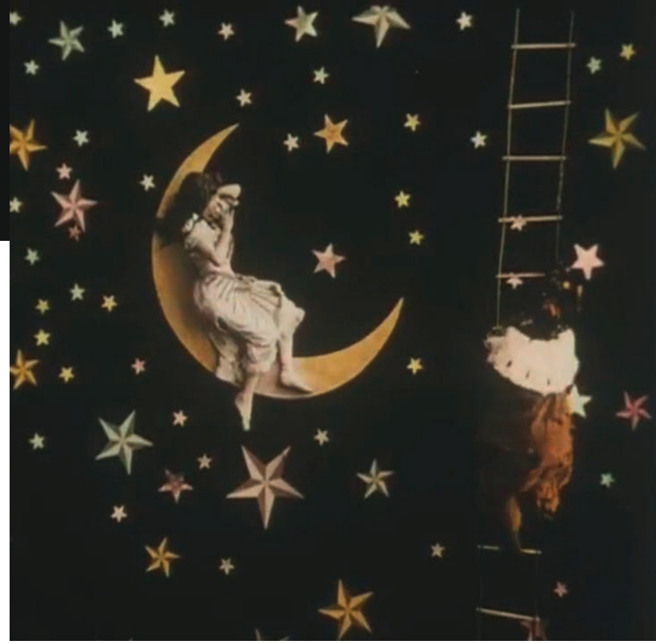
Viaje a Júpiter (Segundo de Chomón, 1909)