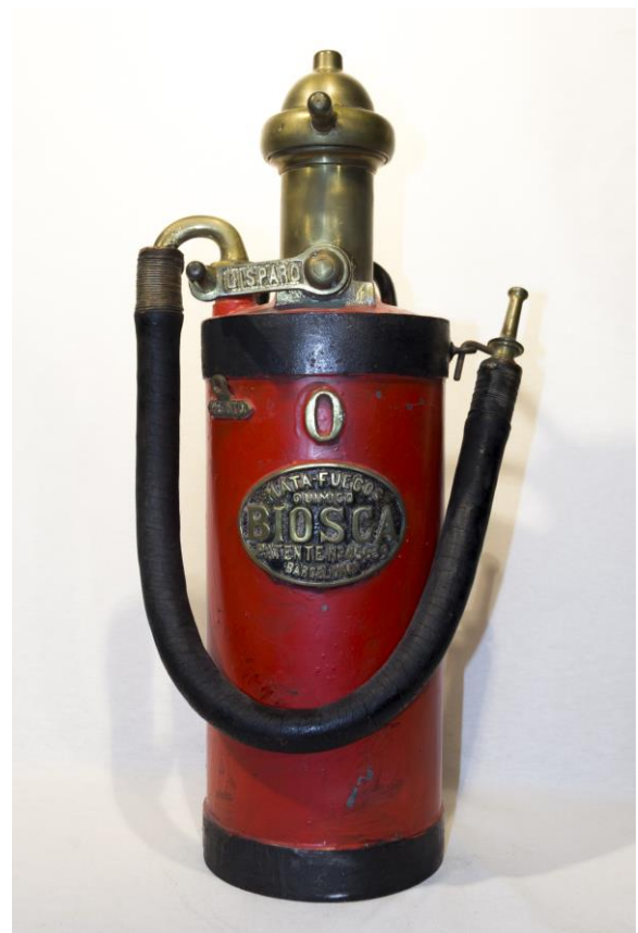
Extintor químico con agente espumógeno datado en la primera mitad del siglo XX