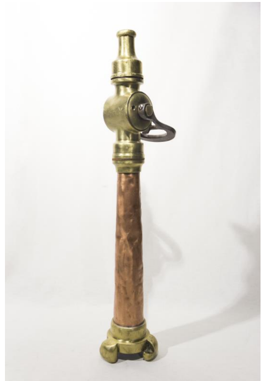
Lanza de manguera de chorro sólido con válvula de cierre datada en la primera mitad del siglo XX