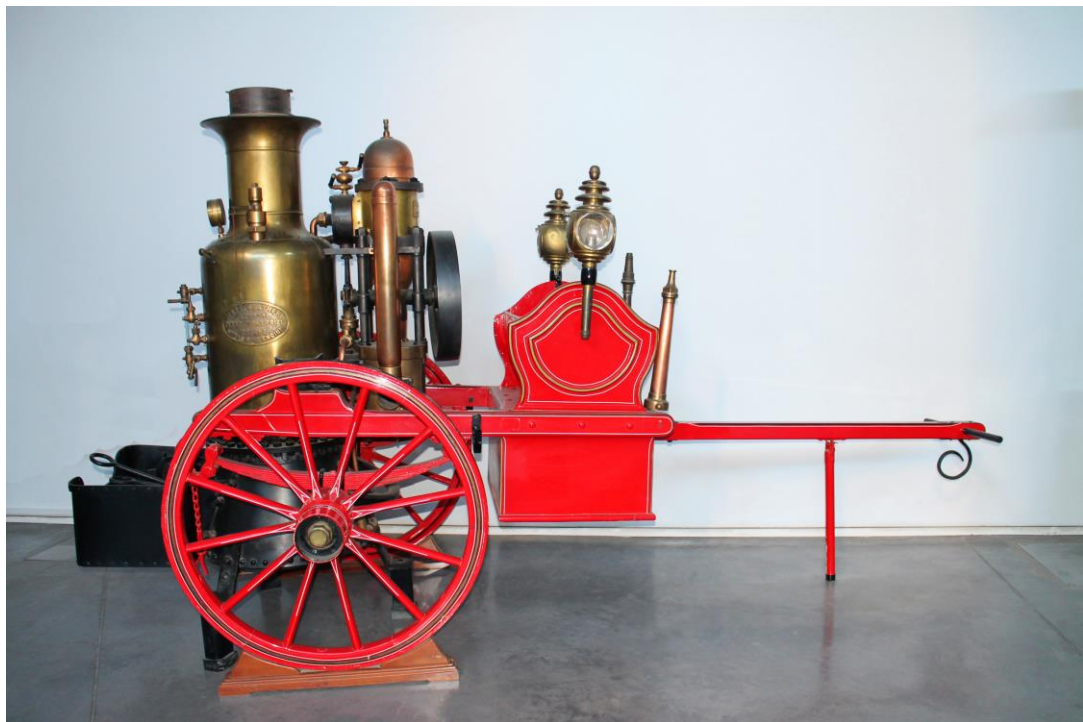
Bomba de impulsión de agua de vapor del siglo XIX