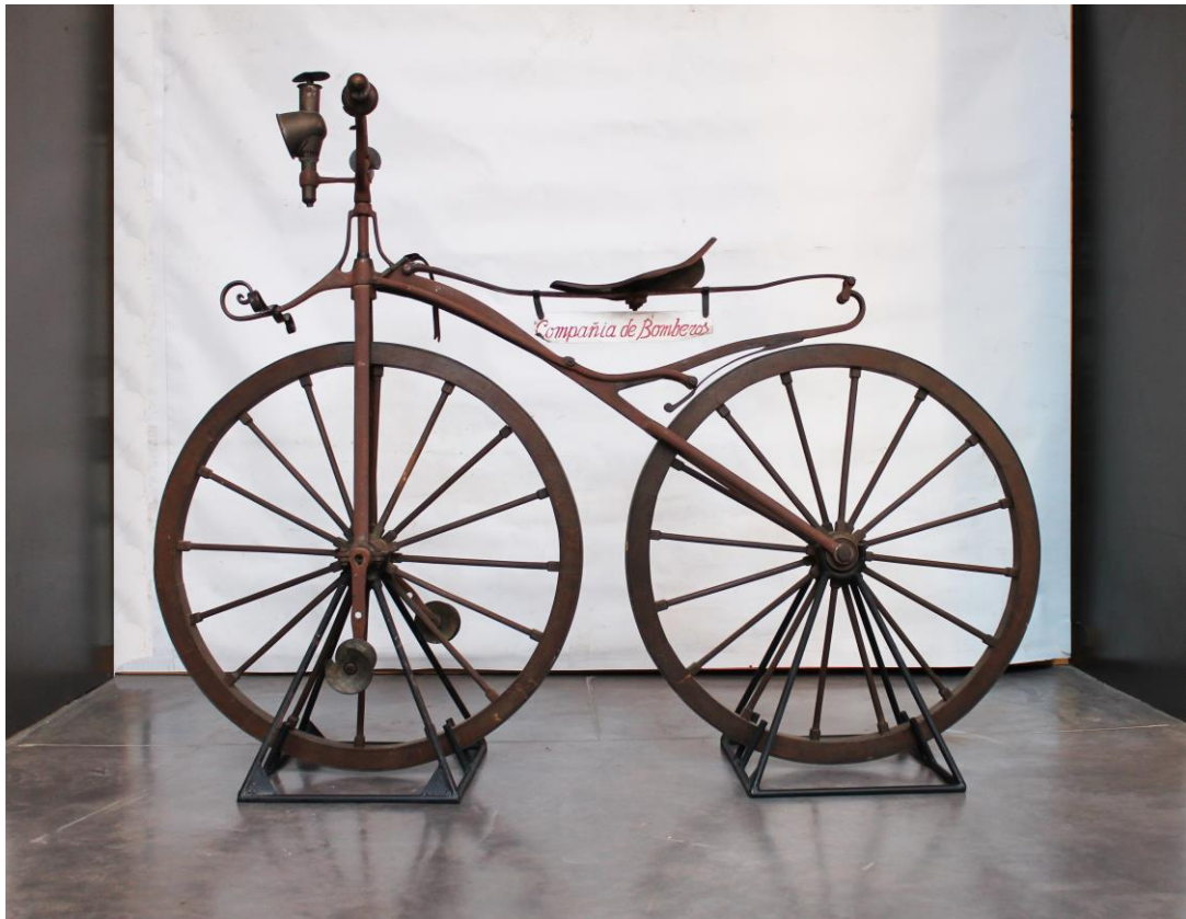
Biciclo del siglo XIX utilizado por los avisadores