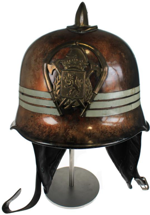
Casco modelo Stahlhelm utilizado por el Cuerpo de Bomberos de Zaragoza entre 1960 y 1985